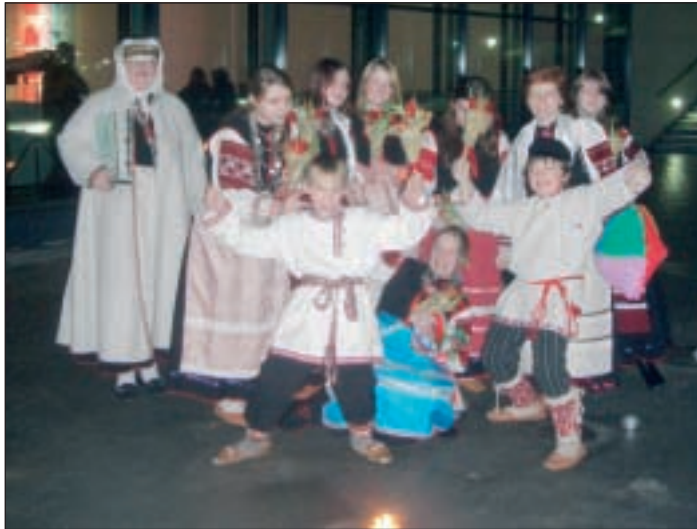
Tunnustusõ ja teno kätte saanu Tsibihärbläse' inne kodosõitu KUMU (Kunstimuseumi) iih.