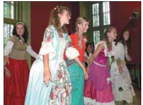
Lossipreilid menuetti tantsimas.