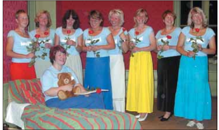
Naisansambel "Vikerkaar" hellitas romantikapäeval kuulajaid unelauludega. Publikut uinutada siiski ei suudetud. Kes tahaks silmi sulgeda, kui laval on nii kaunid naised!