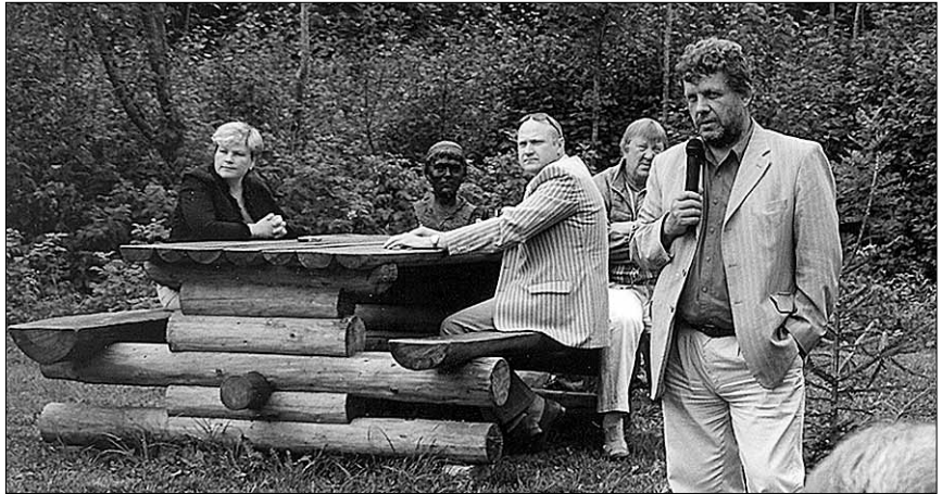
● Viiratsi vallavanema Väino Luige tervitus ja info valla kohta tekitas kuulajates palju positiivseid küsimusi.

Põllumajandusminister Ester Tuiksoo vaatab lootusrikkalt maaelu arengukavale aastateks 2007–2013, nentides: “Elu on paremaks läinud, aga arengumaad on veel küllaga. Olen maavanemaga nõus, et alati ei tasu poliitikuil kuulata – minge aga edasi!”