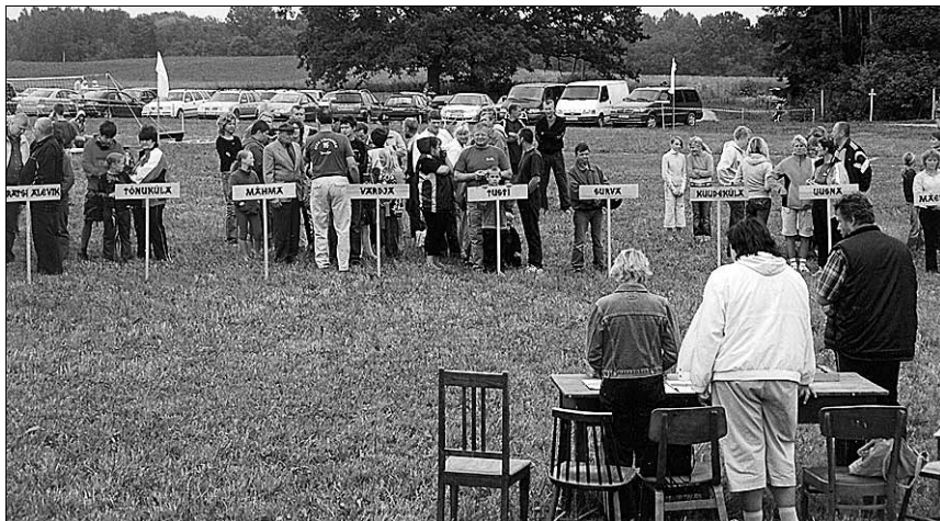
● Külade päeval Vardja külas.