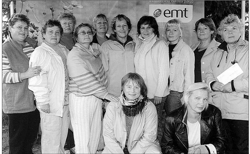
● Volikogu sotsiaalkomisjon ja sotsiaaltöötajad.

Üheskoos osaleti 5. juuli Leigo järve muusika õhtul. Tohutust rahvahulgast hoolimata jätkus pileteid ka viiratsilastele. Sellist emotsionaalset elamust orelimuusikast, Tallinna Poisteoorist ja Tallinna Kammerorkestrist, eriti aga Vene Mungakloostri koori hääleulatusest, mis järvekallastel põlevate