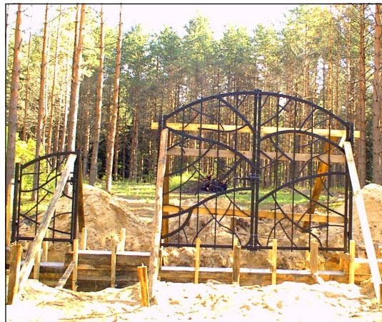
Värvate paigaldus valla kalmistule augustis 2003. Arengukomisjoni töökokkuvõttes 13.09.1994 on kirjutatud, et valla kalmistu peaks valmima aastaks 2010.

4. Pärnumaa kõige ettevõtjasõbralikum vald, parim PPP näide (private – public – partnership).