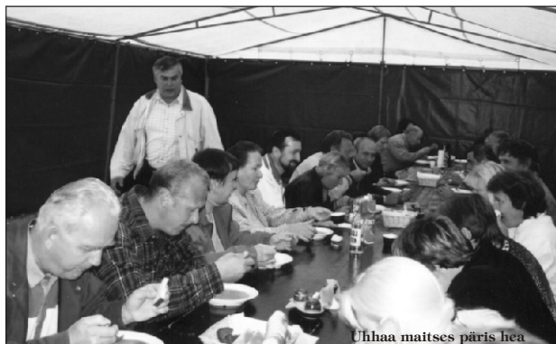
Uhhaa maitsetes päris hea