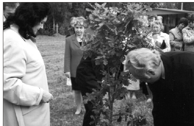
Kuhjaverelastele jääb presidendipaariga meenutama nende istutatud tamm