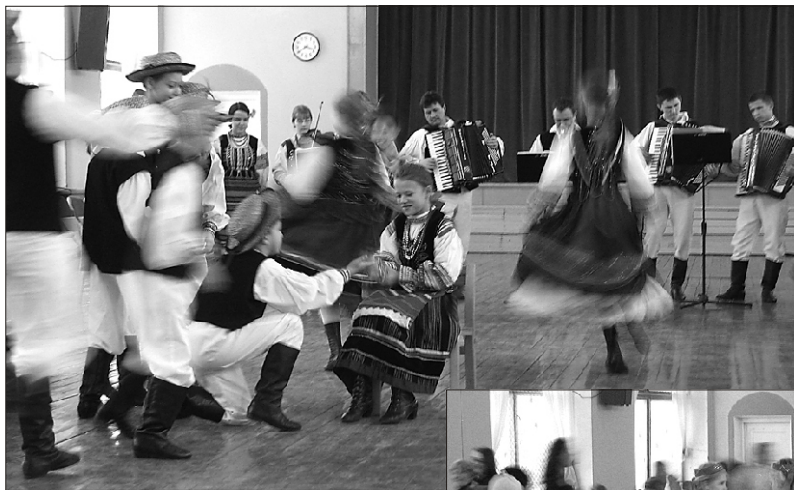
Poola laste naljatants

Viljandi VIII Talvine tantsupidu jõudis sel aastal ka Suure-Jaani.