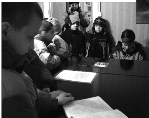
Tantsulapsed Kapi muuseumis musitseerimas

Olümpiamängude avamise päeva pärastlõunal esines Suure-Jaani Gümnaasiumis poola laste tantsu- ja lauluansambel "Podlasiacy". Poolakate lusti ja hoogsat tantsu ning kaudneid rahvarõivaid said näha ka Sürgavere ja Tääksi lapsed. Eesti rah-