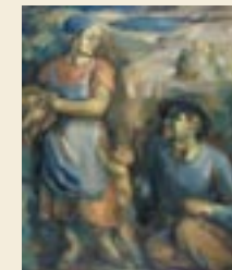
Kaarel Liimand. Lõikus. 1934. Õli, lõuend. 109 x 89.