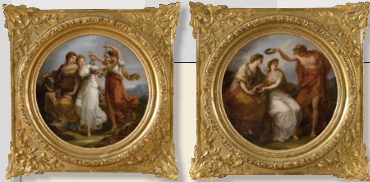
Ilu juhitud Mõistlikkusest, tõrjub meelepahaga eemale Meeletuse ahvatusi. Ca 1780, Oli lõuend. 65,5 x 65,5.