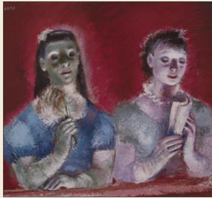
Karin Luts. Comedie-Francaise. 1930. Ölilüüend. 62,5x70.