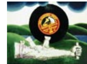
Kaljo Põllu. Kurbus. 1968. Ölilüüend, 49,5x65,2.