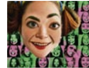
Rühmitus Puhas Rõõm. Punk. Fem. CollectiON 2003–2004. Video.