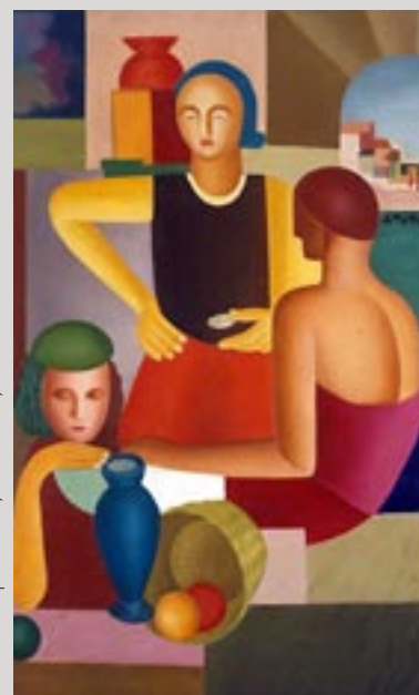
1924. Õli, lõuend. 123 x 99,8.