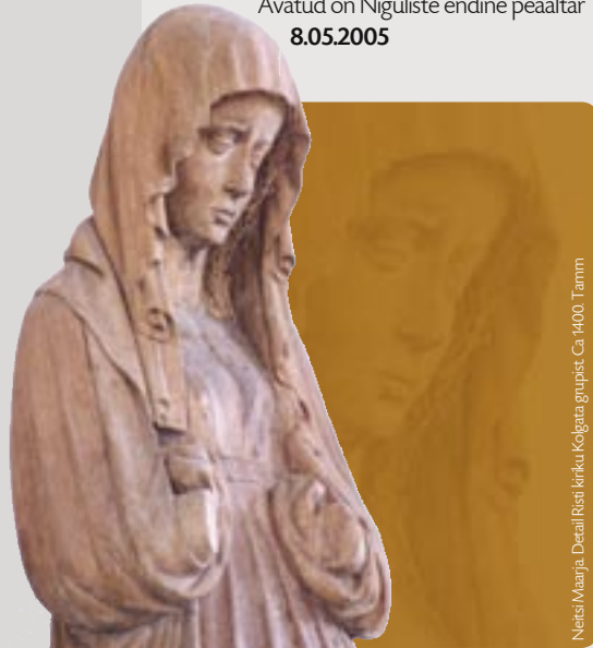
Nesje/Maerju. Detail fra det lirkke Kårgen gruppe. Ca 1400. Tamm

Avatud on Niguliste endine pealtar 8.05.2005