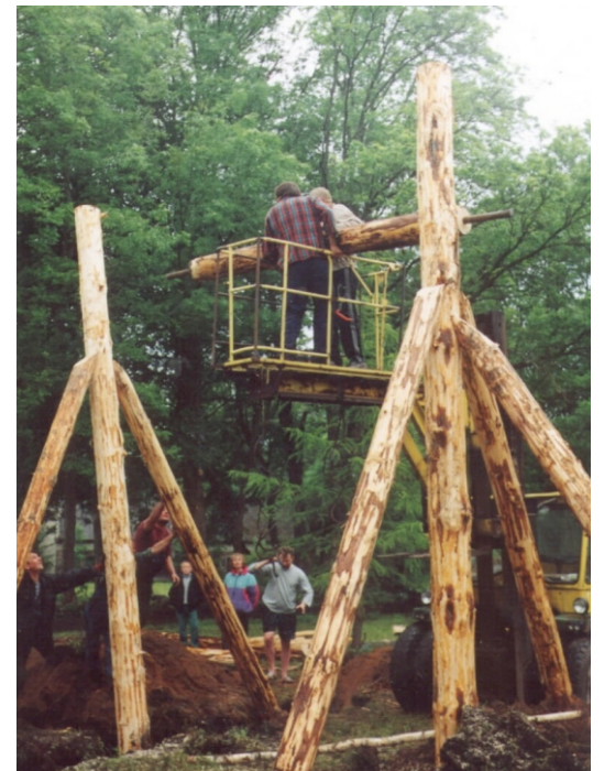
Külakiige ehitamisel on kätte jõudnud otsustav moment: kiigevõlli paigaldamine.