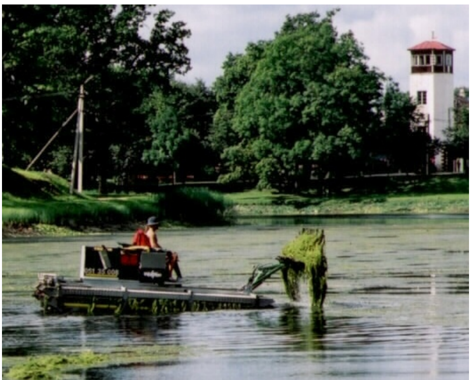
Augusti lõpupäevadel võis Suure-Jaani järvel näha isevärki veesõidukit. Tegu oli järvetaimede niidukiga. 20 000 krooni maksvat "muruniitmist" tuleks korraldada ka järgmisel aastal.