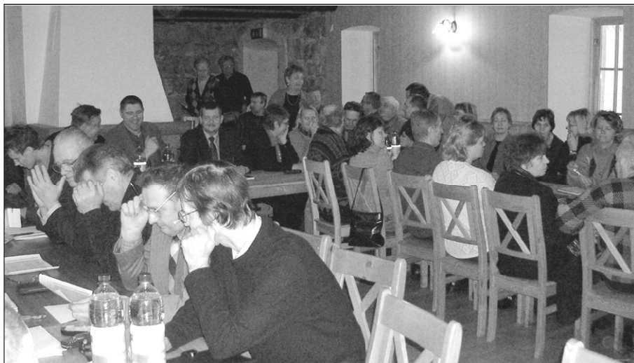
Vanaõue saal mahutas vaevu kõiki nelja omavalitsuse huvilisi.