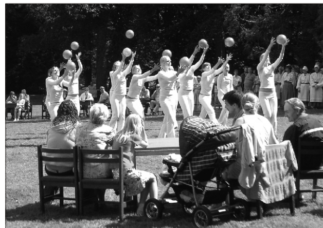
Esinevad võimlejad Tallinnast

Midagi jäi puudu ka. Lossiparki sobiks suursugune puhkpillimuu sika. Rohe-