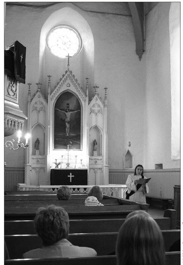
Jumalateenistus-kontsert Suure-Jaani kirikus juunis 2005