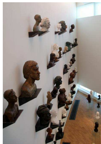
KUMU OSAKAB ÜLLATADA: Pilk ühte näitusesaali, kus suurmeeste pead kõnetasid kunstinautlejaid.

Hea kultuurilaengu andis raamatukoguhoidjaile kui kirjutava kultuuri jüngreile ka kunstitempel KUMU. Toivo Ärtis