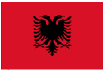
SÜMBOL: Albaania Vabariigi lipul lehvitab punasel taustal tiibu võimas must kahepealine kotkas.

Kotka lapsed – just nii nimetavad end albaanlased, 7-miljoniline rahvas, kellest umbes pooled elavad oma kodumaal Albaanias. Albaania Vabariigi lipul lehvitab punasel taustal tiibu võimas must kahepealine kotkas.