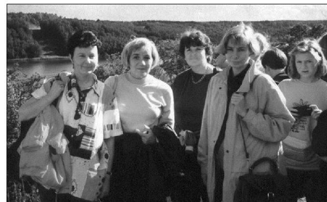
Esimene külaskäik 1994. aastal. Ulvila ja Suure-Jaani kooliõpetajad Viljandi loosimägedes.

Ulvilas on ka laialdased vaba aja veetmise ja sportimise võimalused, mis vaimustasid eriti meie poisse.