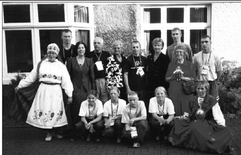
Eesti saatkonnas Dublinis