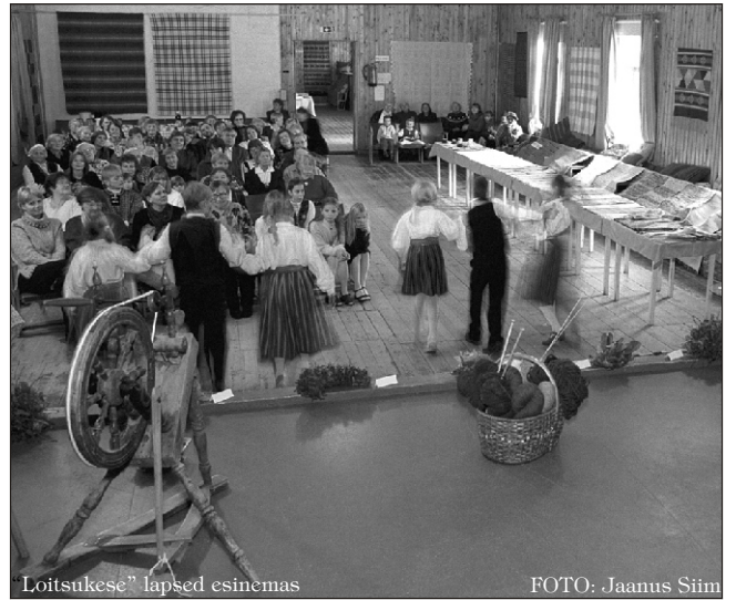
Loitsukese" lapsed esinemas