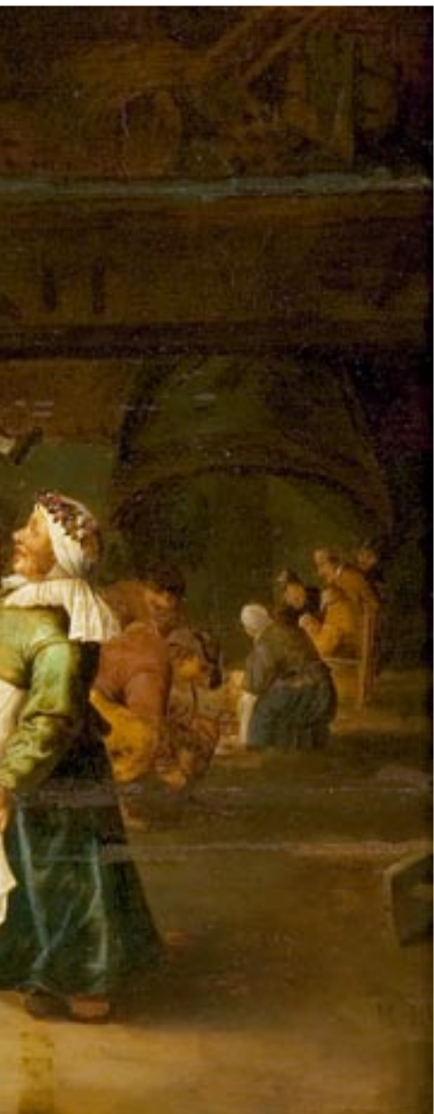
Cornelis Mahu (1613–1689) Pulmatants aidas 1647? Oli puul