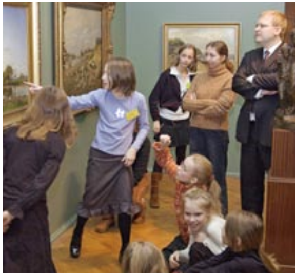
11 last, kes eesti kunsti klassika näitusel "Kohatunne" juhivad muuseumi sünnipäevaprogrammi pealkirjaga VÄIKE ÕPETAB SUURT. Nemad teavad, millest, mida ja kuidas räägivad.