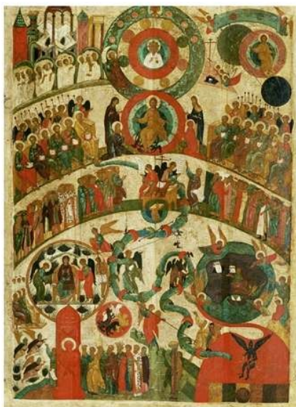
Viimne Kohtupäev Novgorod XV saj

Kõigepüham Jumalasünnitaja, päästa meid.