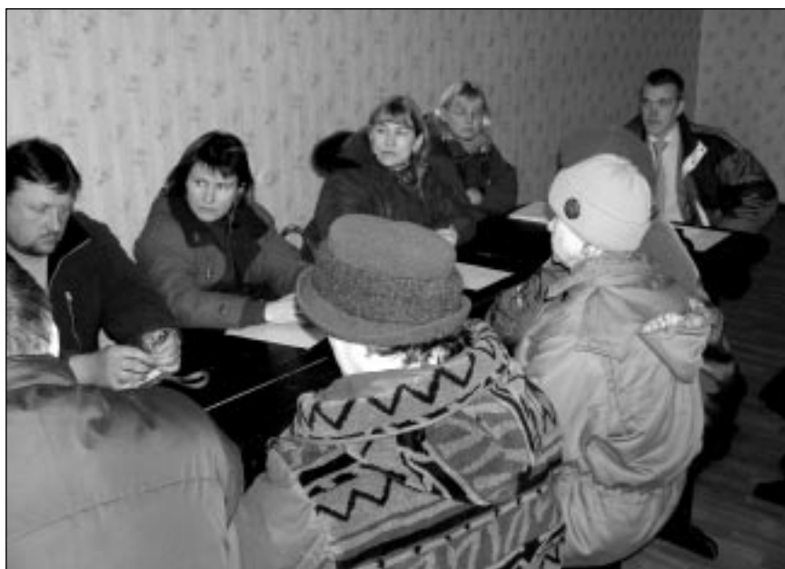
Arengukava arutelu Karula vallas Kaagjärve Külakeskuses.

Saamaks võimalikult laialdast nägemust meie piirkonna tuleviku kohta on läbi viidud arengukava avalikke arutelusid ning kohtumisi erinevate valdkondade spetsialistidega. Alustades konstaablist ja lõpetades koolijuhtidega. Veebruari lõpus toimus koostöös Maaelu Arengu Instituudiga ettevõtjatele mõeldud foorum, mille käigus üritati leida vastuseid tä-