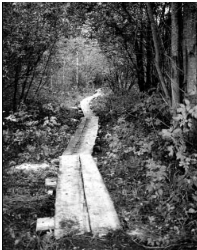
Jupike uut laudteed Ähijärve teerajal.

Viltimisteemalisel käsitööpäeval osales 46 enamas-