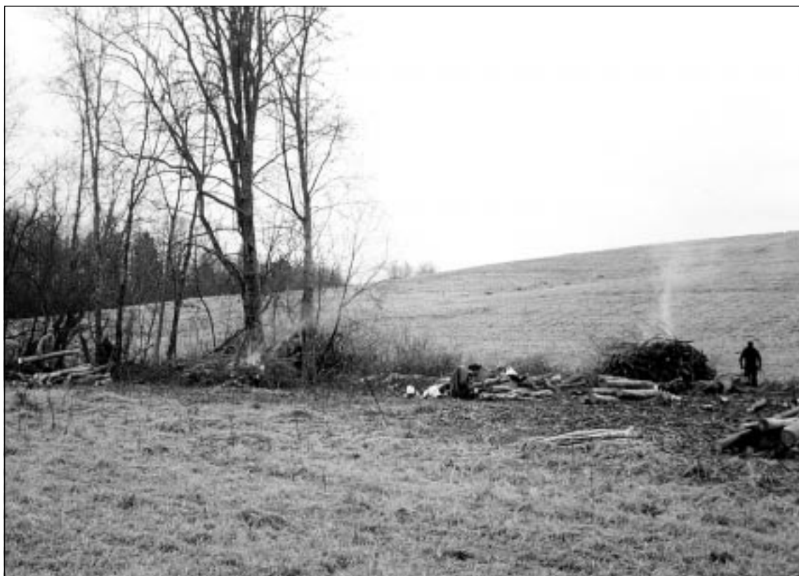
Võsalõikustööd jätkuvad ka aastal 2004. Fotol võsalõikus Rebasemõisas Tornimäel sügisel 2003.

töök vajalike teaduslike andmete ja andmebaaside olemasolu ja kättesaadavuse tagamine ning kaitsekorralduse tulemuslikkuse analüüsimine. Tööülesannete hulka kuulub veel teadus- ja seirealase töö korraldamine ja koordineerimine, praktikantide ja praktikumide juhendamine ning infotehnoloogiat ja kodulehekülje haldamine ning täiendamine. Sel aastal peab seire ja andmehõive spetsialisti juhtimisel valmis saama uue kaitse-eeskirja eelnõu ning lõpule jõudma