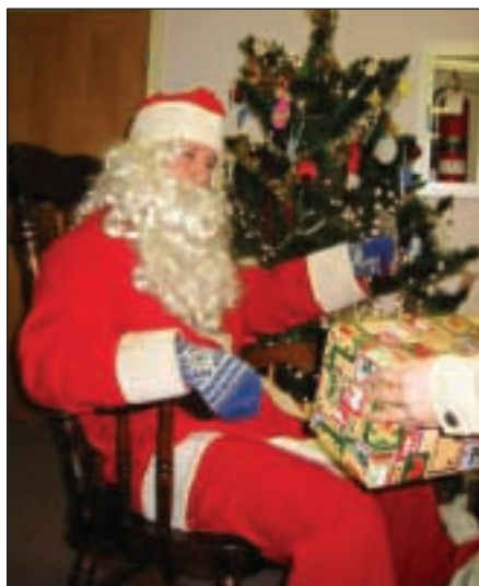
Kohtumiseni BES'i Jõulupuu all.