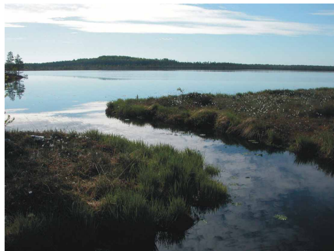
Reiu jõe algus Soka järvest Lätimaal