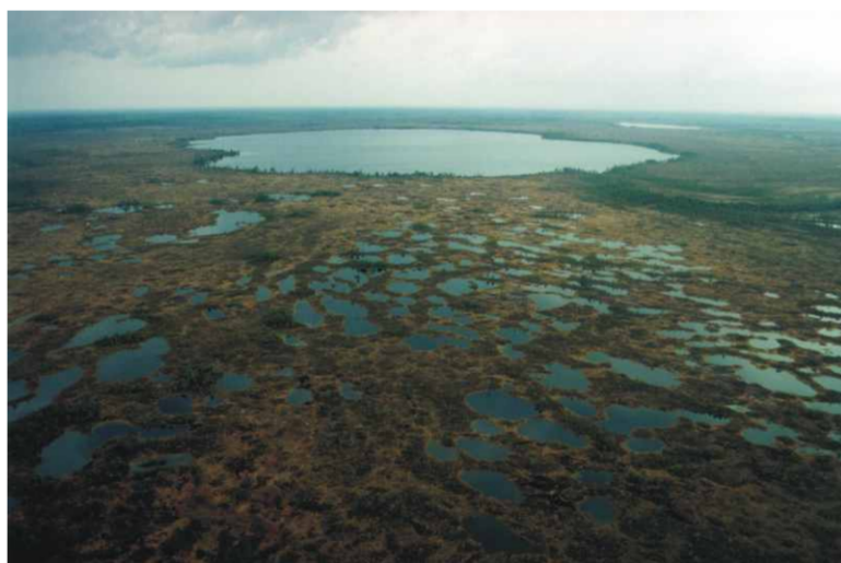
Vaade linnulennult Rongu raba Läti poolel asuval Rõikküla järvele

Tegelikult on Põhja-Liivi märgalade, kui ühtse Ramsari ala, määratlemise esimene samm juba tehtud. 2000. aastal sõlmiti Eesti Vabariigi Keskkonnaministeeriumi ja Läti Vabariigi Keskkonna ja Regionaalministeeriumi vahel kokkulepe sinise looduskaitse koostöö korraldamiseks. Antud lepingu uuendamine võiks olla ühtse piiriülese Ramsari ala moodustamise lahendus.