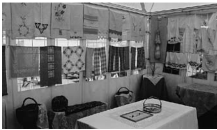
Endisaegsed ja uued köögitekiitid näitusel "Eesti köök läbi mitme sajandi".

Et saada ettekujutust, milline on olnud eesti köök aegade jooksul, otsiti välja ja korjati ümbruskonnast kokku kõikvõimalikke vanaaegseid köögitarbeid. Näitusel olid vanad kohviveskid, petrooleumilambid, puukulbid ja -lusikad, suhkrutoosid, savikausid, vitsi-