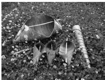
Projekti üks eesmärke on ununenud käsitöötehnikate taaselustamine. Teiste väljavalitute seas on ka tohutööd.

Iga tegevusala puhul püütakse leida uusi lähenemisviise mõlema maa kogemusi kasutades. Projekt pakub ka huvilistele rohkelt