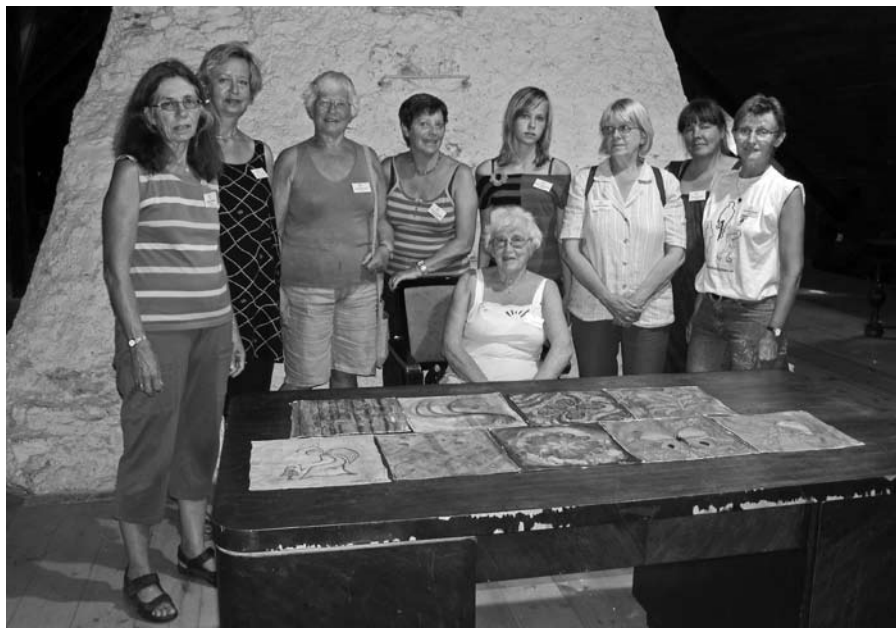
Põhjamaade käsitöölaagris siidimaali kursusest osavõtjad oma töödega.

Õhustik käsitöölaagris oli suurepärase. Kuigi tööpäevad olid pingelised ja õues valitses tõeline leitsak, olid kõik hommikul õhinaga valmis uut tööd alustama. Tundus, et osalejate huvi neile pakutava vastu oli suur. Minugi töötoas oli inimesi, kes soovisid töötada hilisõhtuni välja. Kuigi me ei osanud üksteise keelt, olid meil ühised huvid ja saime üksteisest suurepäraselt aru. Kindlasti osaleksin sellises laagris ka edaspidi, võimalust töö-