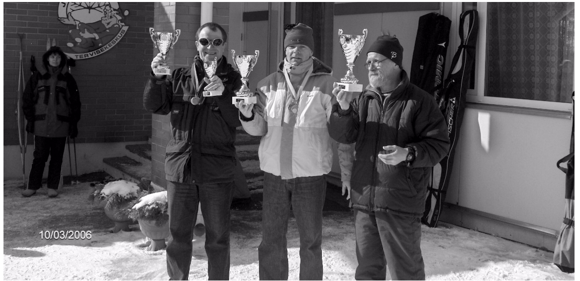
Suusatamise parimad - Põhja piirivalvepiirkonna, piirivalveameti ja Valga piirkonna esindajad autasustamisel.