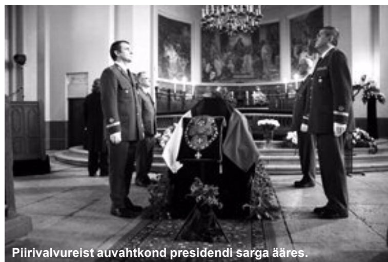
Piirivalvureist auvahtkond presidendi sarga ääres.

suundus Kaarli kirikust Kadrioru kuue leinapärga ja Maarjamäe risti järele. Sargaauto ees marssisid 9 kaitsevägelest leinalintidega riigilippudega. Kolm vahipataljoni aukompanii maa, mere- ja õhuväe vormis rühma ning üliõpilaskorporatsioonid liikusid trummipörina saatel matusekolonnis Kadrioru lossi juurde. Sajad inimesed saatsid presidendi sarka kuni Weizenbergi tänava alguseni, kuhu spaleerina olid rivistatud üliõpilaskorporatsioonide ning ühiskondlike organisatsioonide lipu-