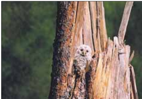
Kaua võib ...