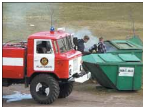
Kütmise käigus tekkinud tuha võib panna prügikonteinerisse siis, kui see on jahtunud.

Jätkuvalt on Alatskivi aleviku üheks suuremaks probleemiks korterelamute puuriidate korrastatus, sest tihti peale jäävad vanad puuriidaseemed koristamata ja laiali. Eriti koledad