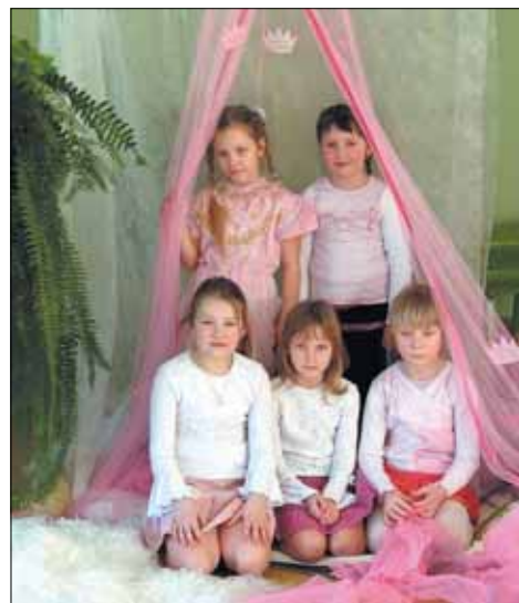
Naistepäevapidu lasteaias. Imekaunis nurgake tüdrukutele.

Eakate sünnipäevatoetus 100 krooni Matusetoetus 1000 krooni Parima keskkooli lõpetaja toetus 1500 krooni Vabadussõjas langenute leskede toetus 300 krooni Makstakse veel prillide toetust lastele, iga konkreetset avaldust menetleb sotsiaalkomisjon ning teeb ettepaneku vallavalitsusele toetuse määramiseks. Vallavolikogu võttis vastu "Hoolekodusse paigutamise, sealt lahkumise ja väljaarvamise korra" Alatskivi vallas, huvitatud saavad määrusega tutvuda ning küsimuste tekkimisel vastused valla sotsiaaltöötajate juures. NB Kelle pension on alates aprillist üle 3000 krooni, peab esitama Tartu Pensioniametisse avalduse tulumaksusoodustuse saamiseks. Kes ei ole veel avaldust esitanud, palume pöörduda valla sotsiaaltöötajate poole. ANNE LUKK Telefon 730 2375