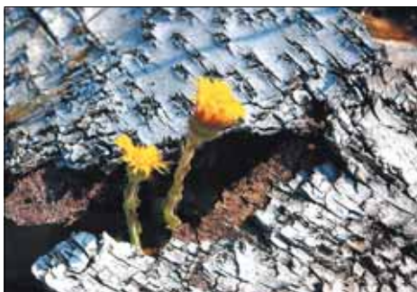
Läbi raskuste tähtede poole ...