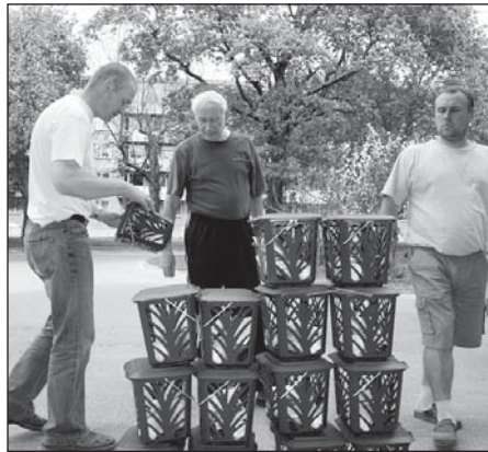
Karja 10 elanikud on seda meelt, et kui konteinerid on olemas, küllap hakatakse neid ka sihtpäraselt kasutama.