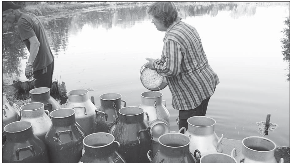
Linna ümbruse jõgedesse lasti 40 piimatünnitait forellimaime, mis kasvavad nelja–viie aastaga.

kolme–nelja sentimeetri pikkused ja umbes poole aasta vanused, mistõttu ka võimelised kohanema uute oludega.