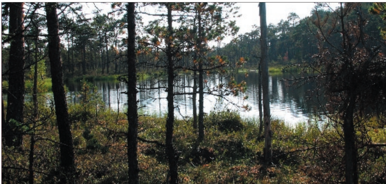
Ka Urvaste valla ainukest raba Ess-sood ähvardab üleskaevamine.