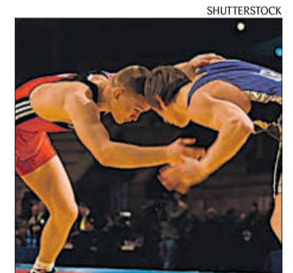
Põltsamaal on tublid noormaadlejad.

Spordiklubi Nipi sai alguse 1996. aastal. „Hakkasime sõpruskonnaga