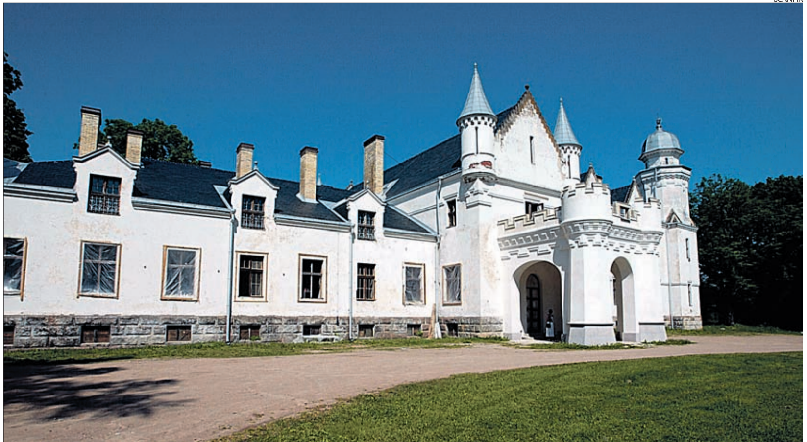
Alatskivi loss muutub aasta-aastalt järjest kaunimaks.

„Mida rohkem vabatahtlikust on Eesti elus, seda parem on meie kõigi elu,“ lausub president Ilves detsembri esimesel pühapäeval vabatahtlikke tunnustades. Mõte, mida meelles pidada ja mille järgi toimeta. Järgmise aasta jõulude ajal võime loodetavasti juba tõeada, et 2009. aasta oli Eestis aasta, mil algas uus tõus. Sest tehtud otsused olid õiged.