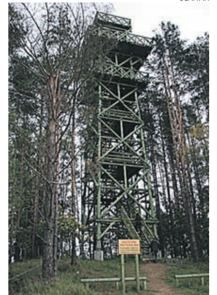
Karula rahvuspargi vaatetorn

Palju tähelepanu on pööratud vaba aja sisustamisele. Kultuurimajas tööta-vad erinevad ringid nii noortele kui ka vanematele inimestele. Omad üritused on raamatukogudes. Sportlikke eluvi-i-se propageerivad SK Karula üritused ja Karula-Lüllemäe Tervise- ja Spordikes-kuse võimalused. Keskuses on võima-lused ööbida, tegutseda jõusaalis, lae-nutada suuski ja uiske. Suvel aitavad elu põnevamaks muuta viburada ja kõrg-seiklusrada. Lisaks on alati kasutatavad Karula Rahvuspargi matkarajad ja RMK puhkealade lõkkeplatsid. Et matkajad ennast väga ühiskonnast eraldatuna ei tunneks, on neil võimalus kasutada val-la rajatud WiFi võrku. Kahjuks ei levi see igal pool kün-gaste ja metsade vahel, kuid igale inimesele ongi soovitatav vähemalt korra elus viibida Karula metsades ja