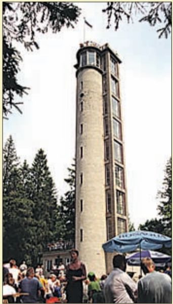
Suure Munamäe vaatetorn