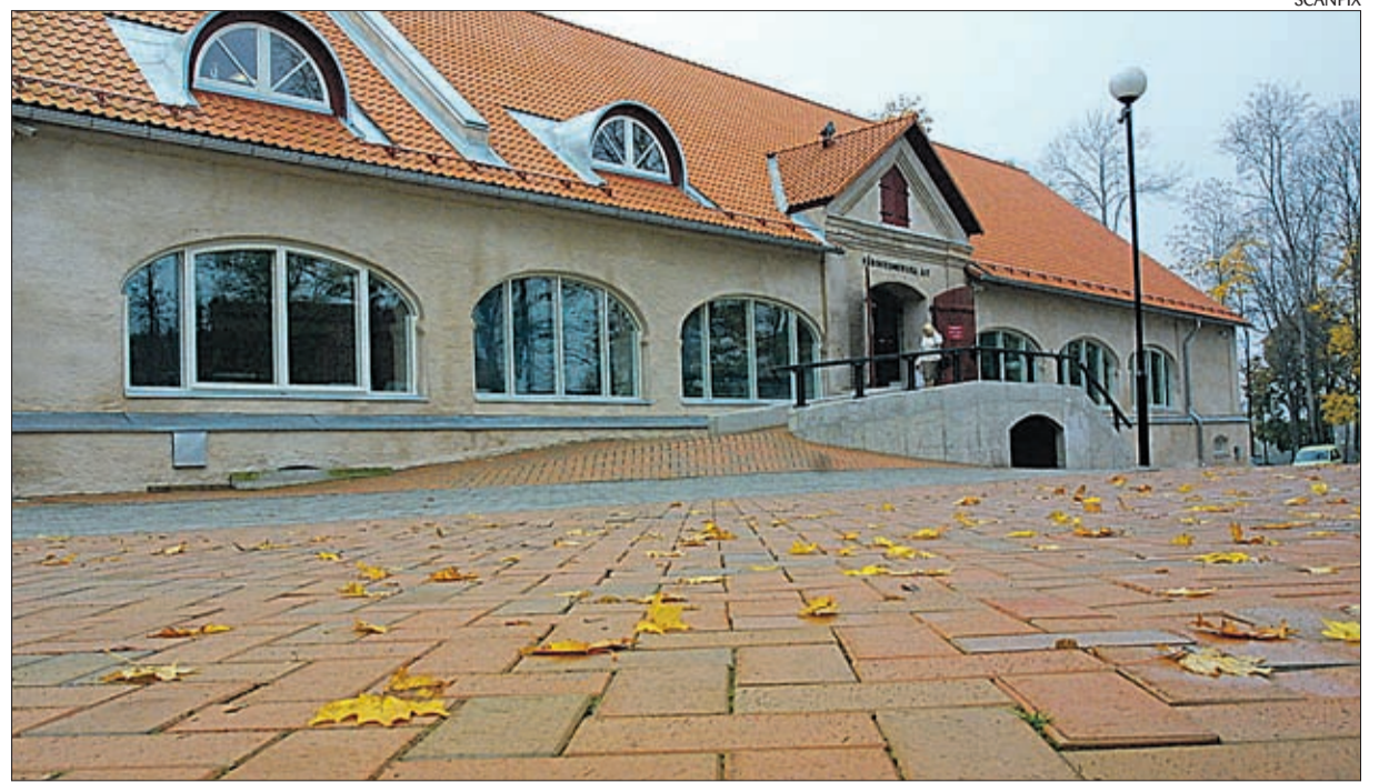
Viljandis valmis sellel aastal Pärimusmuusika Ait.

Järjest realiseerub meie pikaajaline koolide remondiprogramm ja 1. sep- tembril avas ukseid nii seest kui väl- jast täielikult renoveeritud Carl Ro- bert Jakobsoni nimeline Gümnaa-