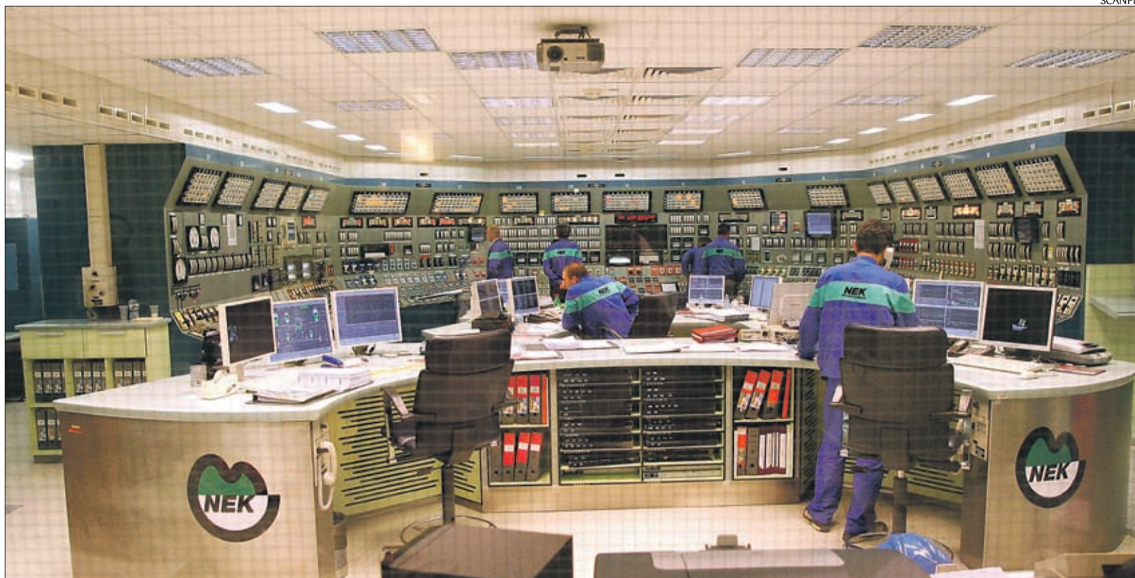
Moodsa tuumajaama rajamine on keerukas ja aeganõudev tegevus, mis nõuab vastava seadusandluse olemasolu.