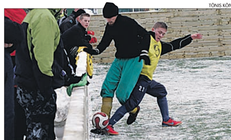
Hetk Türi jalgpalliväljaku avamiselt.