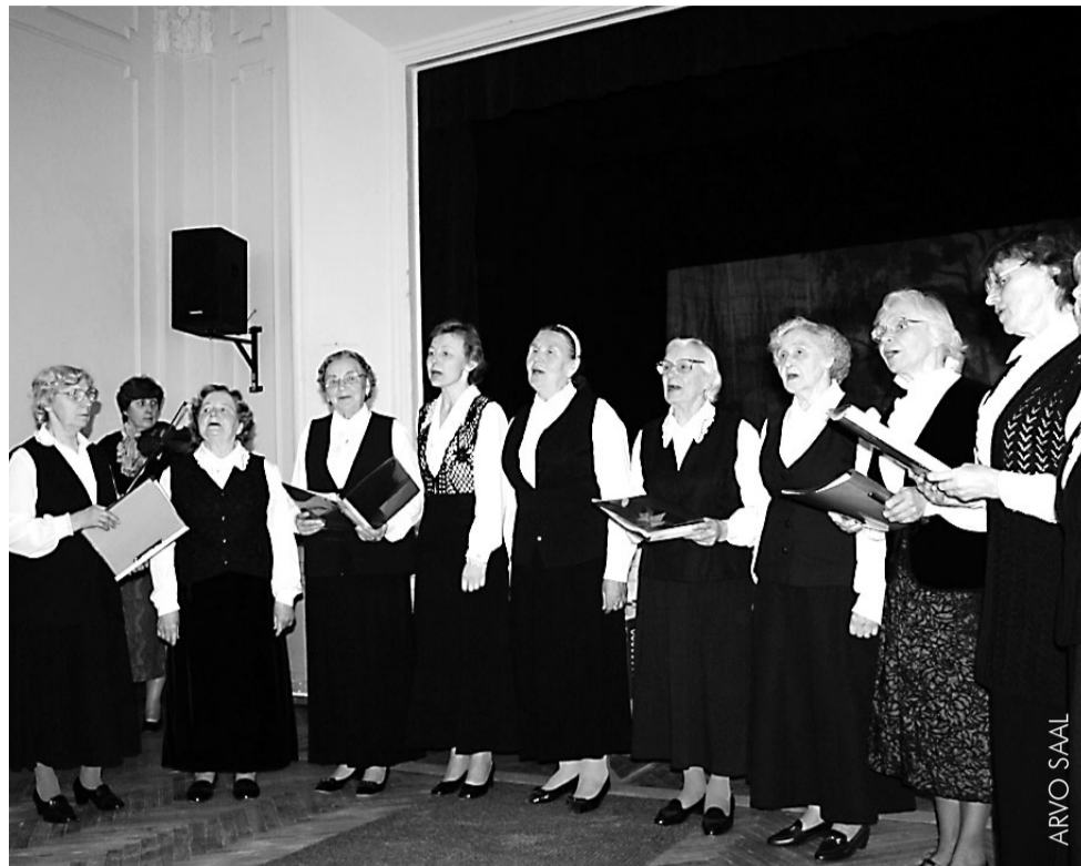
Naisansambel Laulurõõm esinemas Otepää Teataja 75. sünnipäeval.

Sõprusuhted Pirita Sotsiaalkeskusega said alguse nende suvepäevadest, mil võõrustajaks Otepääl oli sinne päevakeskus. Nii saabus kutse pealinnast tulla vastukülaskäigule, mis sai teoks märtsi alguses. Fondist taotletud raha toel sai