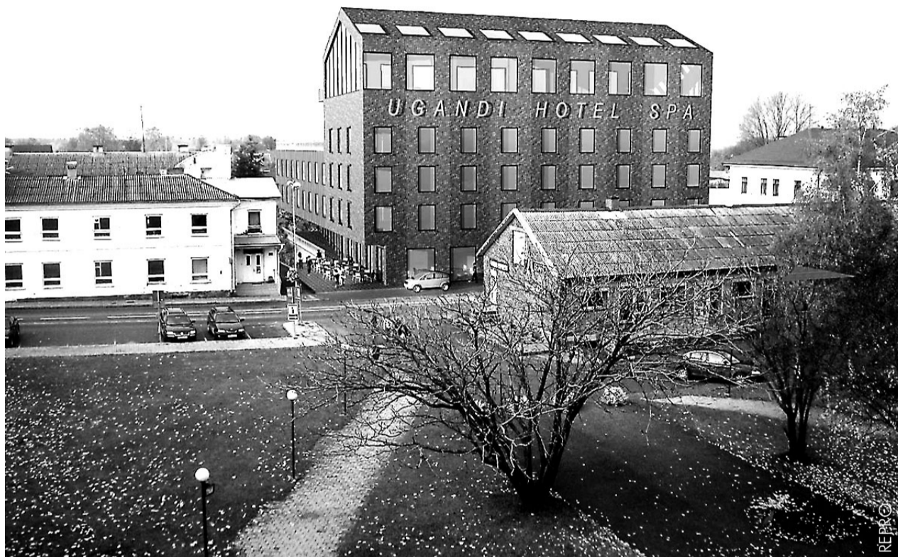
Selline peaks olema varsti Otepää kesklinn.

Hotellis on alumisel korrusel restoran, kohvikud ja poed, kolm järgmist on majutuskorruused kokku 85-90 toaga ning kõige kõrgemal asub spa. Lille tänava poolal on siseõu ja