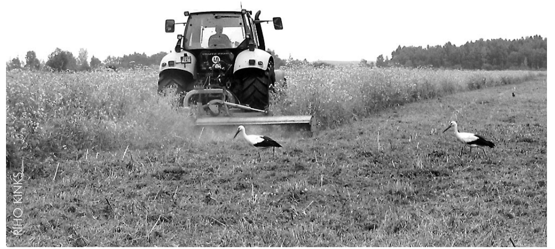
Poollooduslike koosluste säilimise eelduseks on nende iga-aastane hooldamine.

2007. aastal makstakse poollooduslike koosluste hooldamise toetust Natura 2000 aladel PRIA kaudu. Kõigepealt tuleb taotleda kontrollida PRIA kodulehelt ( www.pria.ee ) põllumassiviide veebikaardilt või Riikliku Looduskaitsekeskuse (LKK) regiooni kontorit,