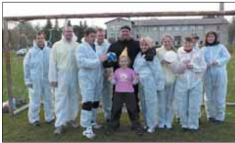
Lapsevanemad on jalgpallilähinguks valmis.