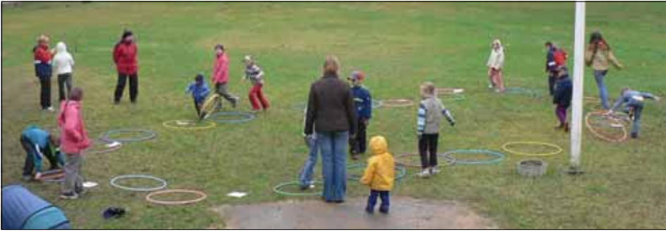
Laumängude õhtul veeretasid lapsed suurt täringut ja nende vanemad liikusid nappudena lustlikult mööda maastikule paigutatud mänguvälja.