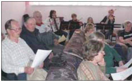
"Kääri käised ülesse, asu tööle kallale!" laulsid käsitöövõimelised Alatskivi rahvapillide saatel enne näituse avamist.

Perepäevadega sai alguse uus traditsioon - kevadised (emadepäevale keskendatud) ja sügised (isadepäevale keskendatud) perepäevad Alatskivi vallas. AVL