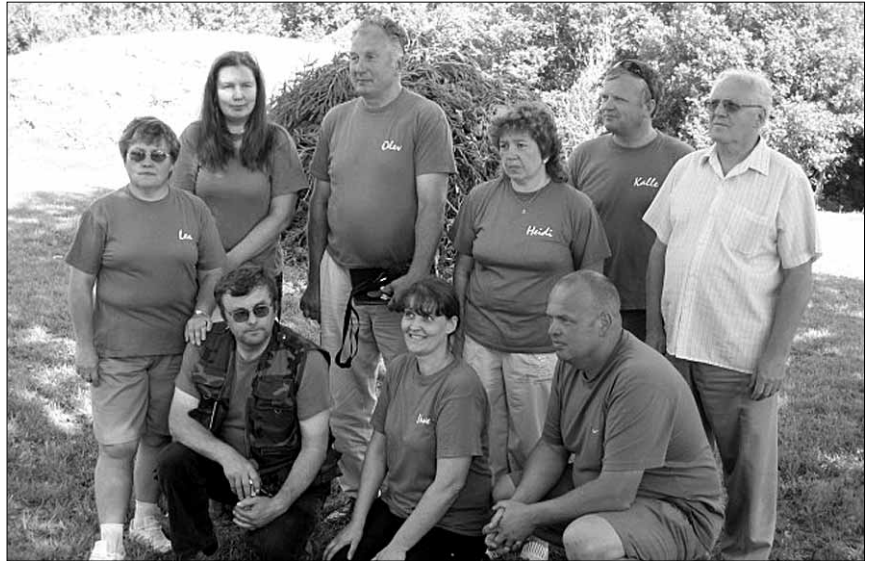
● Ühtsuses peitub jõud – meie külavanemad.