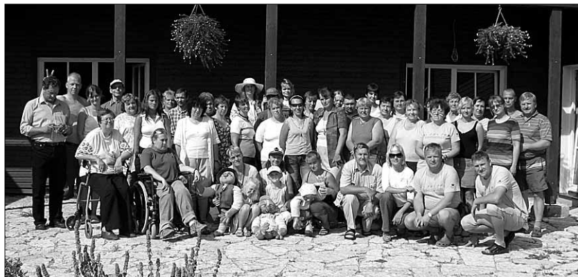
● “Hapeco” suvekool Vanaõuel.

Järgnes arutelu sotsiaalse ettevõtluse võimalikkusest tänases Eestis. Laias laastus võib selle teema alla võtta töövõimaluste loomise riskirühmadele (osalise töövõimega inimesed, pika-