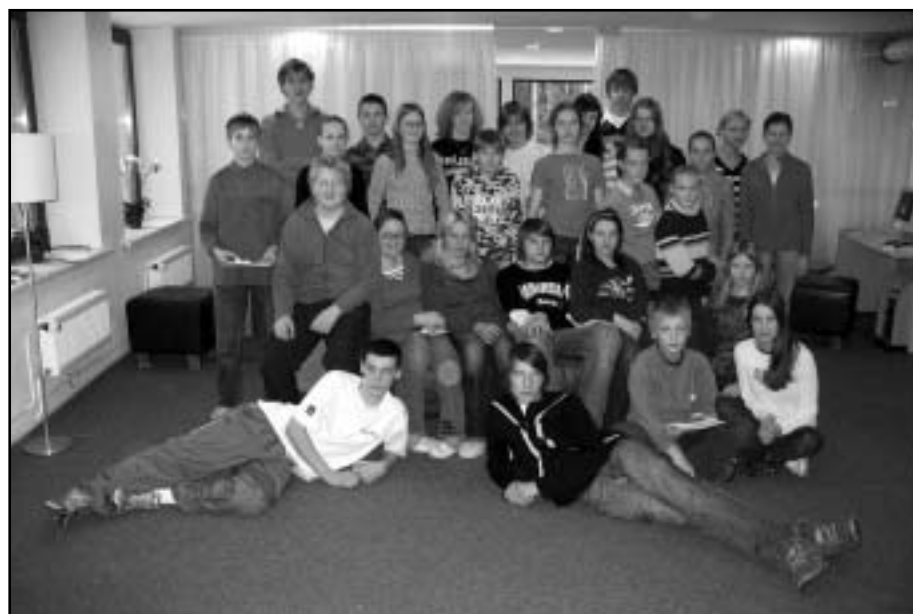
Eesti ja Läti noored loodushuvilised.