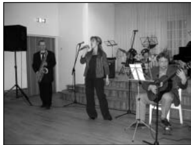
Räpina Muusikakooli õpetajad ei ole lihtsalt õpetajad...