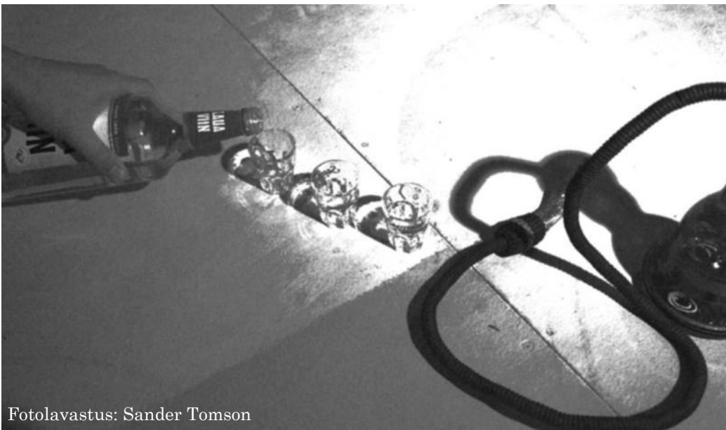
Fotolavastus: Sander Tomson