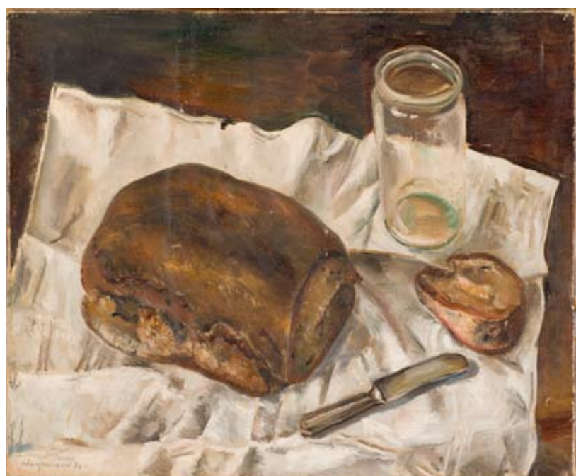
Adamson-Eric. Leib, soolapurk ja kala. 1928. EKM