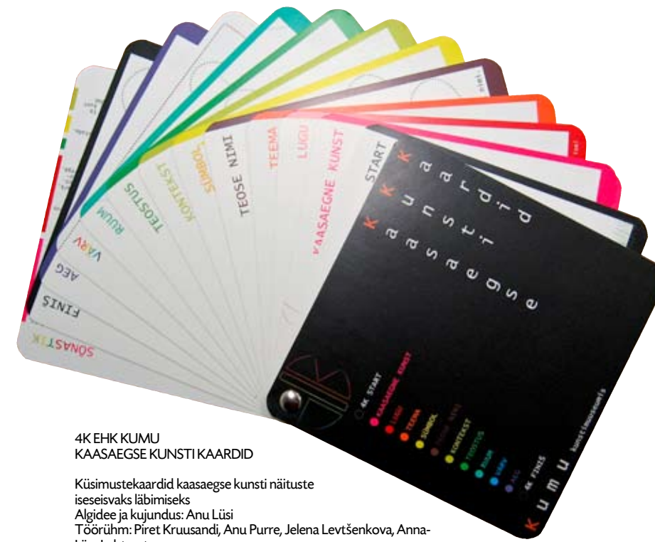
4K EHK KUMU KAASAEGSE KUNSTI KAARDID

“Virtuaalne documenta ” on Kumu 4. korruse B-tiivas avatud 2. märtsini 2008.