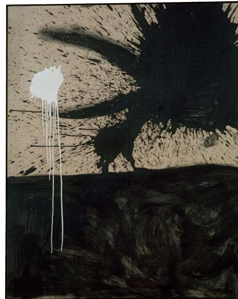
Joan Miró. Nimeta. Dateerimata. Akrüül Iouendil. Fundació Pilar i Joan Miró a Mallorca