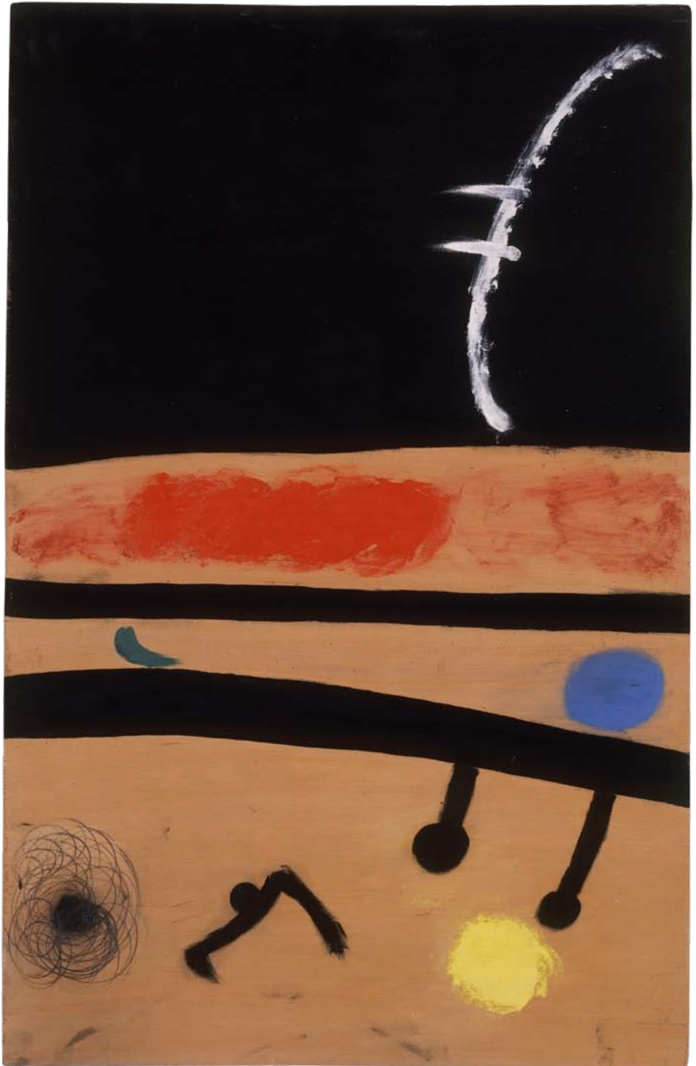
Joan Miró. Nimeta. 1975/1978. Õli ja pliiats vineeril. Fundació Pilar i Joan Miró a Mallorca

EESTI KUNSTIMUUSEUMI AJALEHT NR 13 DETSEMBER 2007