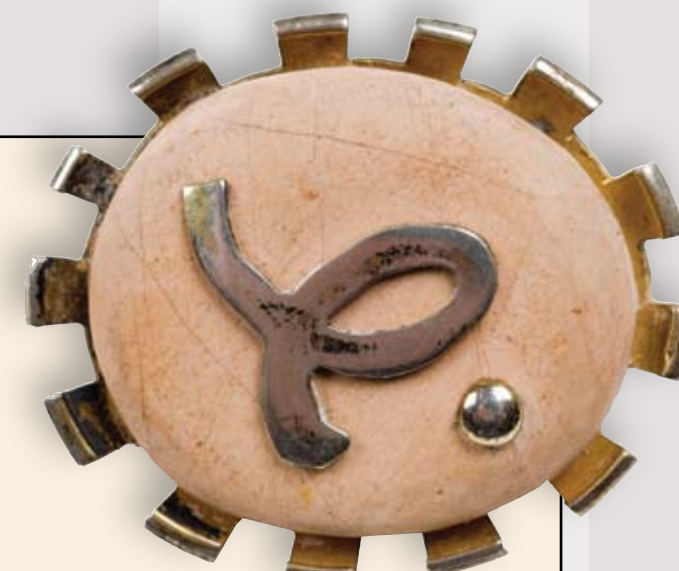
Adamson-Eric. Rinnanõel. 1960. aastad. Kullatud hõbe, looduslik kivi. EKM

Näitus "Maakivi eesti ehtekunstis" on Adamson-Ericu muuseumis avatud 2. märtsini 2008.