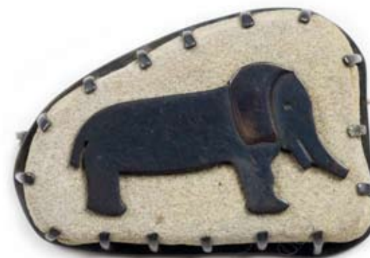
Adamson-Eric. Rinnanõel. 1960. aastad. Looduslik kivi, hõbe. EKM