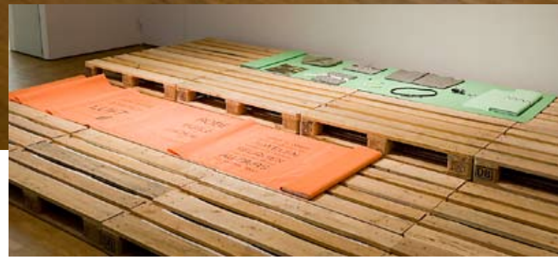
Eran Schaefer. Taasesitus (Moodulid). 1995