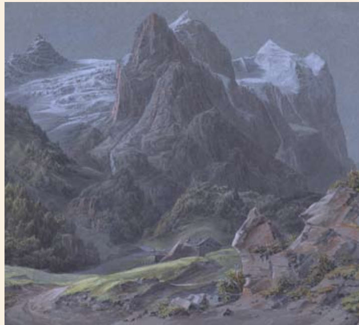
A. M. Hagen. Alpimaastik. 1821–1822. Akvarell. TÜ Raamatukogu