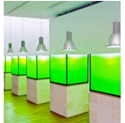
Twin Gabriel. Limonaad. Aafrikast. 1996

ja New Yorgi vahelist kunstisilda, käi- vitus Berliinis endas hulganisti atrak- tiivseid näitusevorme, messe, bienna- le, avati kunstikeskusi ning muid kuns- ti edendavaid asutusi. Linn finantseer- ris kannatlikult suurte kunstiprojekti- de elluviimist ja integreeris endasse to- hutus koguses tundmatust ja maailma silmis eksootilisest Ida-Euroopast pä- rit kunstnikke.