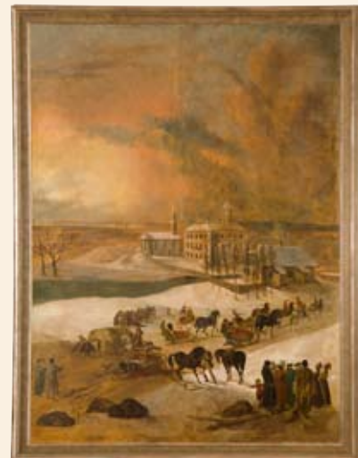
Gottlieb Welté. Põltsamaa lossi talvine vaade. 1783. EKM

Näitusega kaasneb kaks klavessiinikontserti (7. oktoobril ja 25. novembril), samuti toimuvad loengud ja haridusprogrammid.