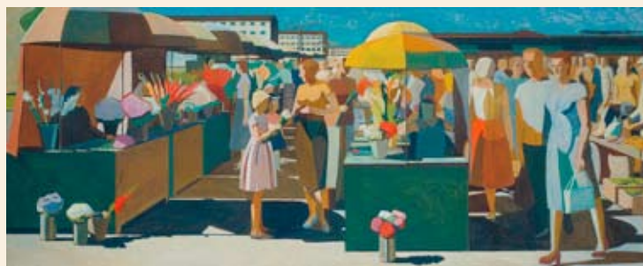
Henn Roode. Turg. 1961. EKM

Info E–R 12.00–15.00 tel 602 6126 või kumu.giid@ekm.ee.