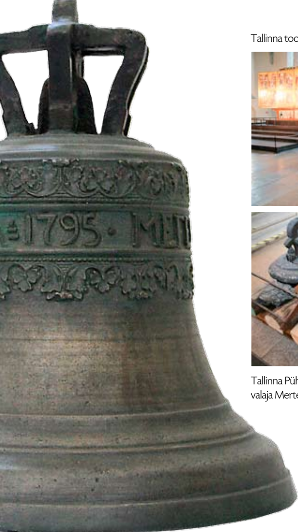
J. Malmbergi valatud kell, 1795