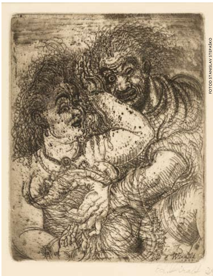
Eduard Wiiralt. Kirk. 1929. Ofort. EKM

ROGER PIERRE TURINE EMMÈNES MOIS, 2007, NR 119, MÄRTS-APRILL