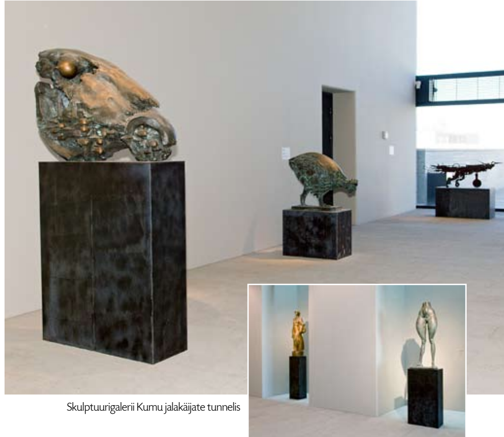
Skulptuurigalerii Kumu jalakäijate tunnelis