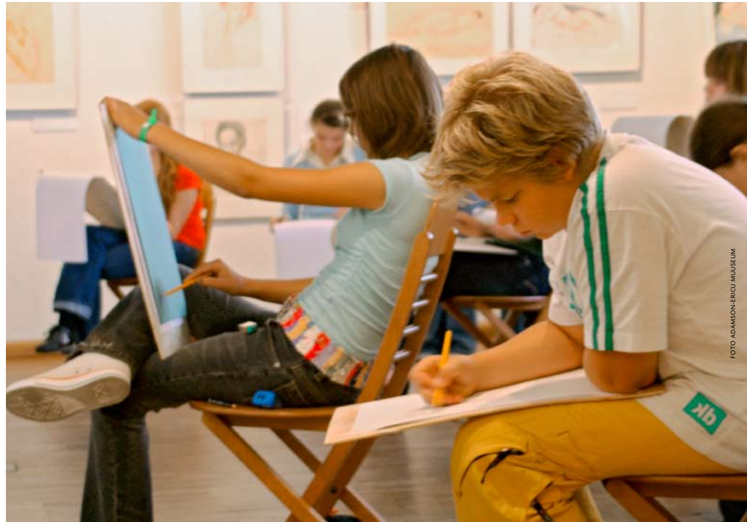
Kunstitaager Adamson-Ericu muuseumis suvel 2006

Heaks võimaluseks põhiharidust täiendada on iga näituse juurde kuuluvad haridusprogrammid, mis tutvustavad ka alati mõnda põnevat kunstitehnikat. Väga aktiivsed nendes osalema on eelkoolialised ning algklasside lapsed. Nemad on just see osa muuseumikülastajatest, kelle puhul võib eredalt näha, kuidas kunst muudab maailma, kujundab uusi arvamusi ning arusaamu. Lisaks on Adamson-Ericu muuseumis saanud tavaks rõõmustada koolinoori talve- ning suvevaheaja laagritega, kus võib juba tõsisemalt kunstnikuks olemisele pühenduda. Varasematel aastatel on teostele lähenetud taimemotiivide, maastikulummuse, müstilise näge-