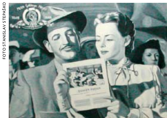
Jevgeni Fiks. Song of Russia. 2005. Õli, lõuend. Osa seeriast

Vastutuse programmiline ja teadlik ärapõlgamine kultuuriloomelise valdkonnas on vahest üks iseloomulikuid jooni postsovetlikus kunstis. Endise idabloki maade kunstielus on 1990. ja 2000. aastatel olnud läbivaks trendiks eitada vastutust, tõugates seda endast eemale kui postsovetlikku konteksti sobimatut ja võõrast elementi. Enamasti eelistatakse just vastutustunde otsesest vastandit – vastutustundetust, mis haakuks justkui ainsa alternatiivina käesoleva hetkega.