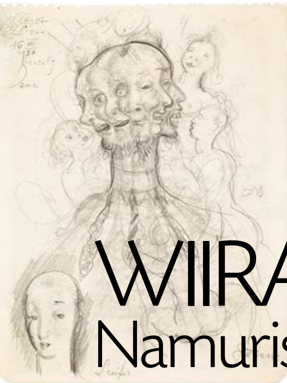
Eduard Wiiralt. Visand "Põrgule". 1930. Pliats. EKM