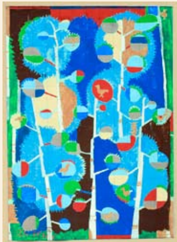
Adamson-Eric. Vaibakavand. 1937. EKM

Eesti esinemist 1937. aasta Pariisi maailmanäitusel ("Kunst ja tehnika moodas elus") on peetud vägagi edukaks, kuid uuri- tud lünklikult. Viimastel aastatel on õnnestunud leida eri kogudest uut informatsiooni ning tulnud veenduda selles, et osa suursündmuse materjale ei jõudnudki mitmesugustel asjaoludel Eestisse. Siiski on säilinud nii teoseid kui ka kavandeid, diplomeid ja mälestusi.