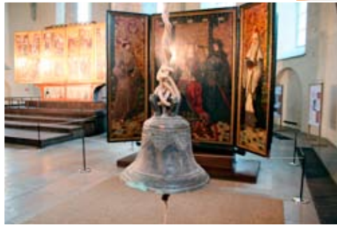
Tallinna toomkiriku kell, 1722