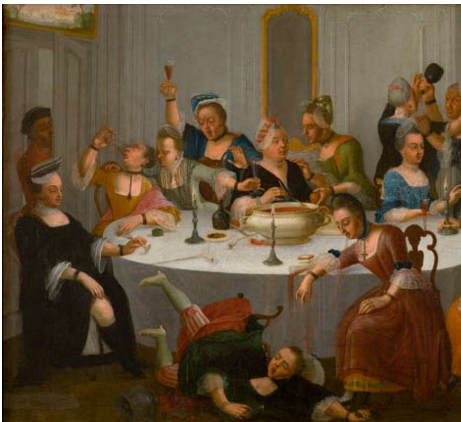
Tundmatu Saksa kunstnik William Hogarthi järgi. Südaõine keskustelu. 18. sajandi lõpp. Õli, lõuend. EKM

Tundmatu Saksa kunstniku maalitud “Südaõine keskustelu” jälgendab William Hogarthi üht populaarseimat tööd. 1822. aastal valmis William Hogarthi vasegravüür “A Midnight Modern Conversation”, mis kindlustas Inglise kunstniku iroonilises võtmes teostatud tööde populaarsuse Euroopas. Mikeli muuseumi maal jälgendab Hogarthi kompositsiooni, mille ohjeldamatu meeste pidu on asendatud naiste peoga. Maali alumises vasakus nurgas on veel teinegi viide inglise kunstnikule, vaevuoletav nimi WILLIAM HOGARTH.