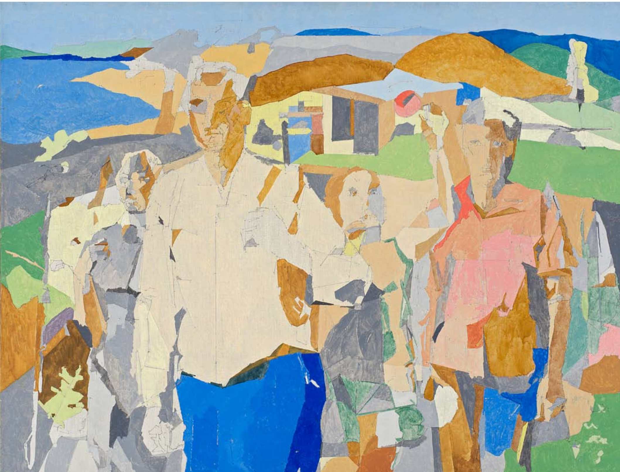
Henn Roode. Teekaaslased. 1970–1971. Õli, lõuend. EKM

EESTI KUNSTIMUUSEUMI AJALEHT NR 11 JUULI 2007