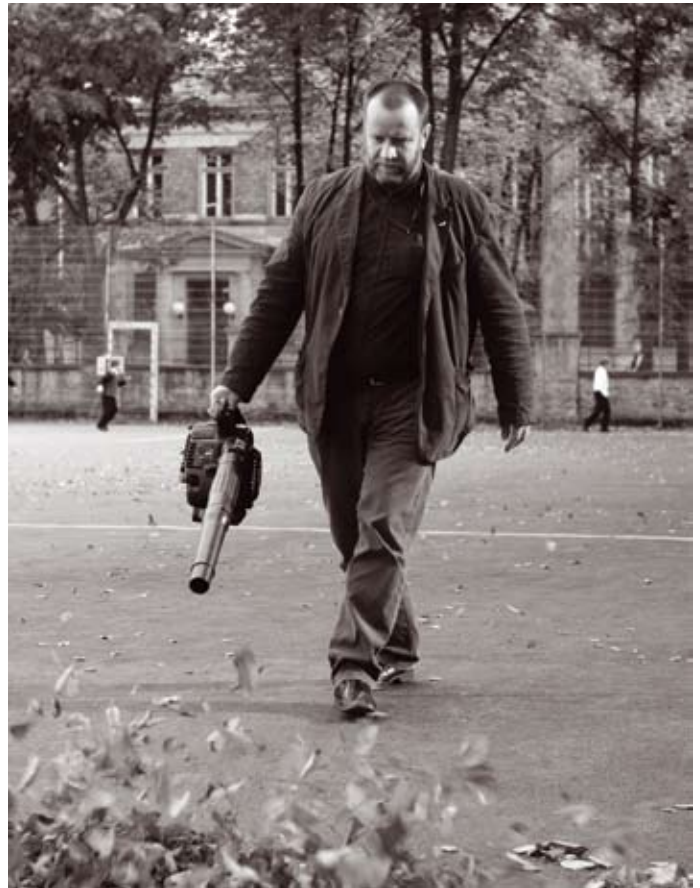
Veiko uut lehepuhurit testimas

Mis on järgmiseks? Minu arvates pole asjad ilma inimeseta mitte midagi väärt. Asi muutub kasulikuks, kui neid vahendatakse kellegi poolt. Eesrindlik olek ei väljendu selles, kui palju on võimalik asju kokku koguda, vaid kui palju suudetakse nende kohta edasi anda. See Eesti füüsika ja teiste loodusteaduste mustast august välja toomine on väga oluline. Üheks plaaniks on robotika kursuse toomine Reaalkooli õppekavasse juba algklassidest. Aine osa saaks olema tähtis, aga õppimine peaks toimuma läbi mängu. Nii on lastele seda kergem selgeks teha. «Pehmet Eestit» pole rohkem vaja, vaid vaja on «Reaalset Eestit» Heaks