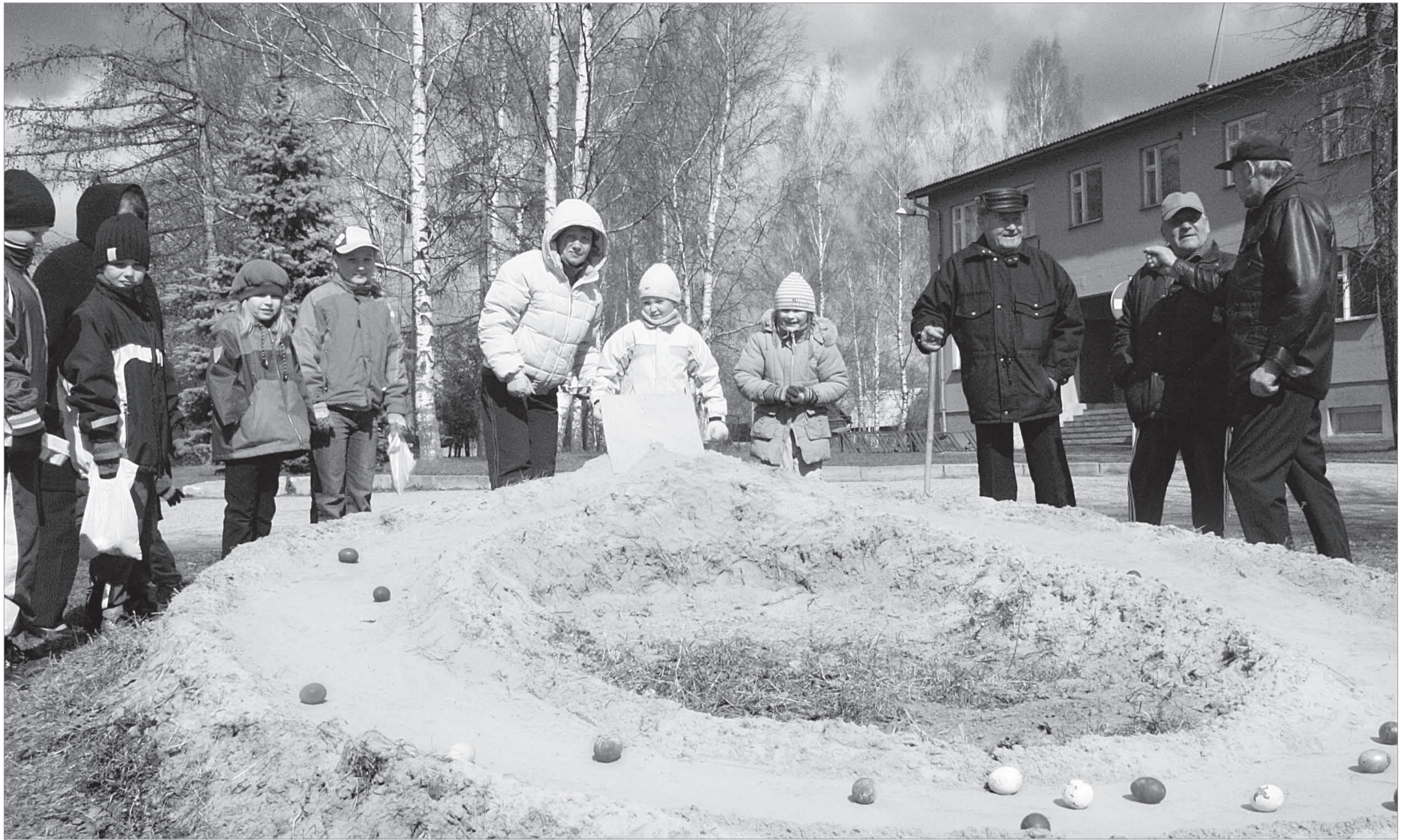
LOOMPICAL: läinud aasta Lihavõtete ajal Mikitamäel tundsid munaveeretamisest enim rõõmu kohalikud lapsed, kuid vanemad mehedki ei jätnud loompka ääres käimata.