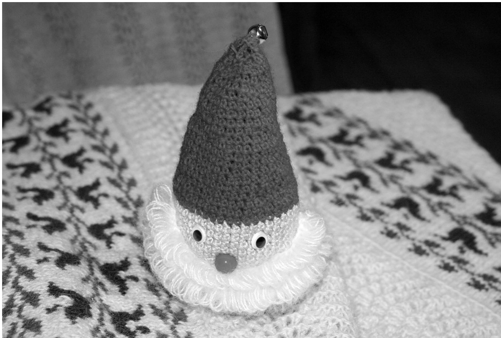
Näitusesaalis võib kudumite vahel piilumas näha ka Anu Uudelti heegeldatud kavala olemisega päkapikke.