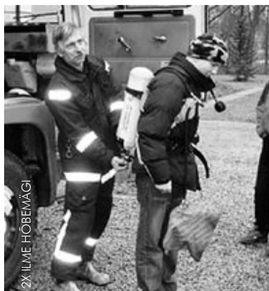
2X ILME HÖBEVÄGI