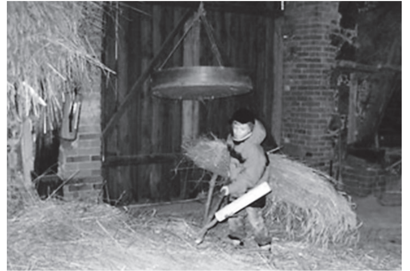
Risto koodiga reht pekmas

Teises suures hoones oli arvukalt põllutööriistu, pilte põllutöö tegemistest, jahu jahvatamisest jne. Jõudsime järeldusele – põllutööde nimekirja viljast leiva saamiseni on ikka väga pikk ja töö raske.