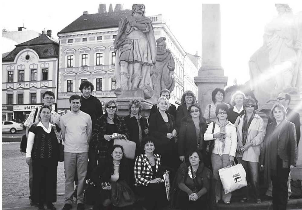
Partnerkoolide esindajad Kolini linna keskväljakul.