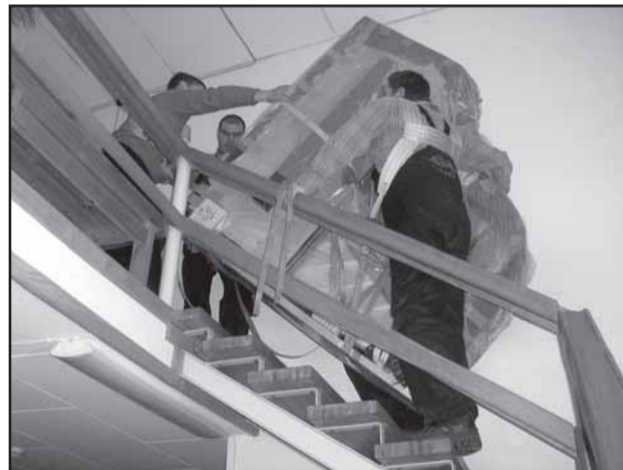
Neli meest, klaver seljas - läbi raskuste tähtede poole