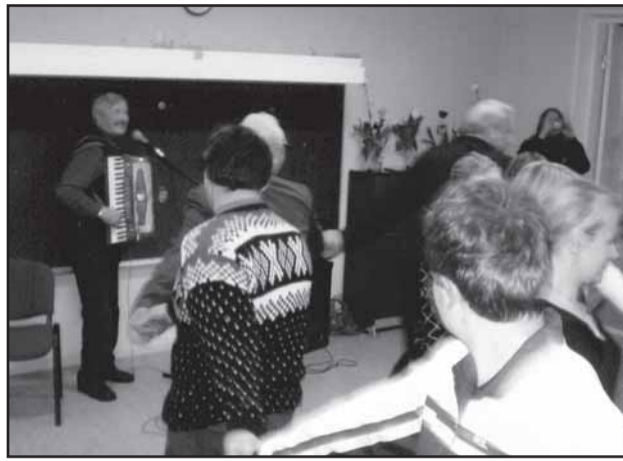
Valduri poolt akordionist võlutud viisid loovad meeleolu ja annavad peole hinge.

Naha rahvas on uhke oma inimeste üle ja kõiki mõistetakse, arvestatakse kõigi isikupäraga. Eriti uhked on inimesed ning armastavad meie küla akordionisti, kes leiab alati Elvast, kus ta töötab muusikakooli õppejõuna, tee koju oma inimeste juurde, et neid oma imekaunite