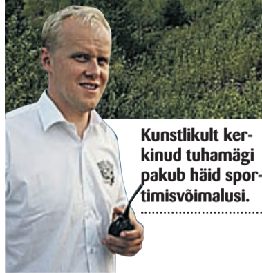
Kunstlikult kerkinud tuhamägi pakub häid sportimisvõimalusi.

test tööd on tehtud suuremahulised pinnasetööd. Meil on valmis Eesti pikimad, 400 kuni 650 meetri pikkused mäesuusa- ja lumelauarajad, mäesuusatamise õppenõlv ja lumerõngarada lastele,” räägib Olt.