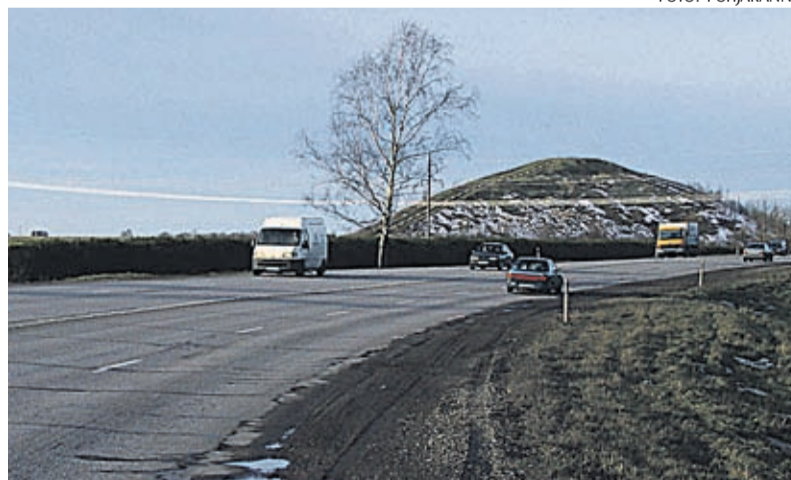
Euroopa Liidu toel investeeritakse Tallinn-Narva maanteele sadu miljonid.

Vastavalt Maanteeameti taotlusele algatas Ida-Viru maavalitsus septemb-