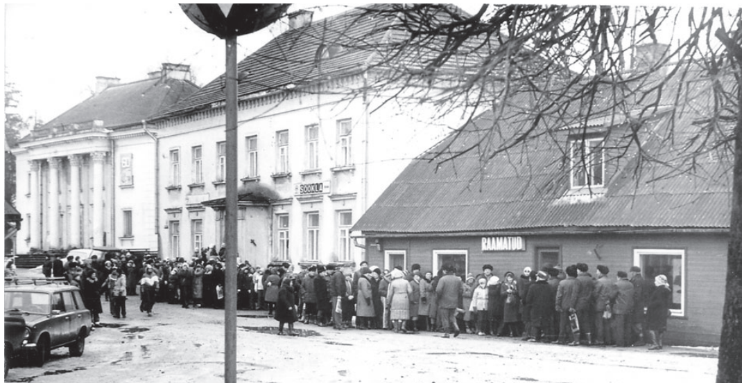
Otepäälaste "raamatuhullus" veerandsada aastat tagasi ...

Eriaine tänu kuulub meie ostjatele, kes on ikka leidnud tee raamatupoodi! Nii võiks see kesta jätkuvalt.