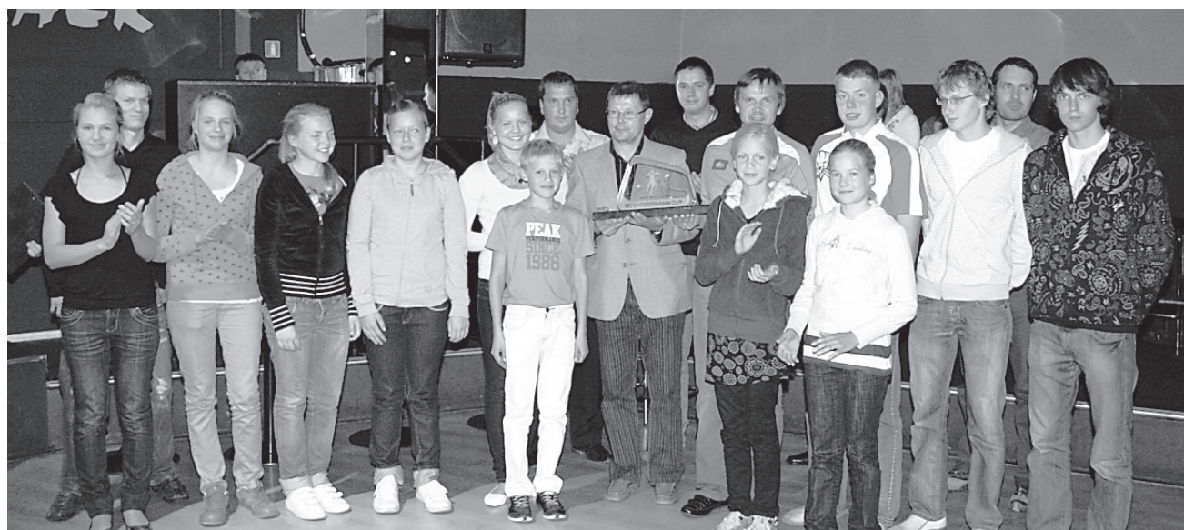
Pilt karikasarja lõpetamisest. Pildil sarja üldvõitja Oti Spordiklubi Zahkna Team

Osavõtjate arv on jäänud üldiselt samaks väikese tõusuga, mis on tänases olukorras märkimisväärne. Plusspoolele võib kanda meie lõunaabrite Leedu ja Läti noorsportlaste osalemise nii talvistel kui ka suvistel etappidel. Tänu neile on konkurents tõusnud.“