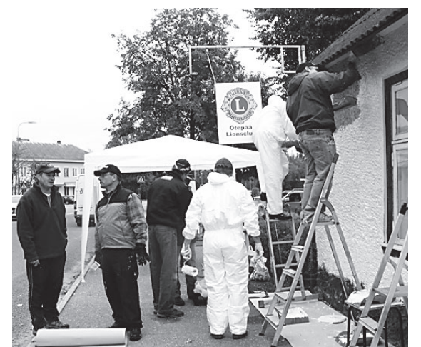
Otepää Lions klubi maja värvimas.

9.10. kell 20.00 Otepää Kultuurikeskuses KINO . Action-komöödia Maxwell Smart-Agent 86 , pilet 20,-