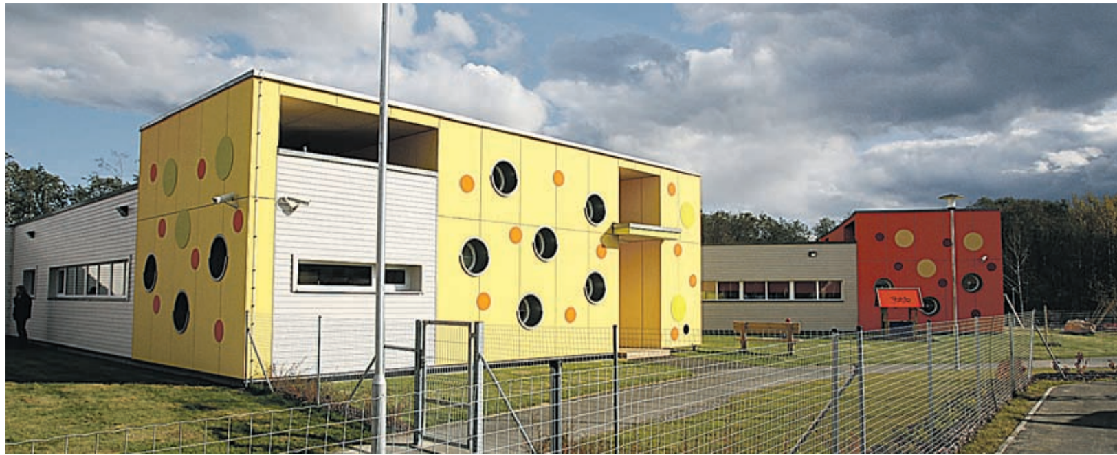
Hiljuti valmis Jüris 120-kohaline Õie lasteaed.