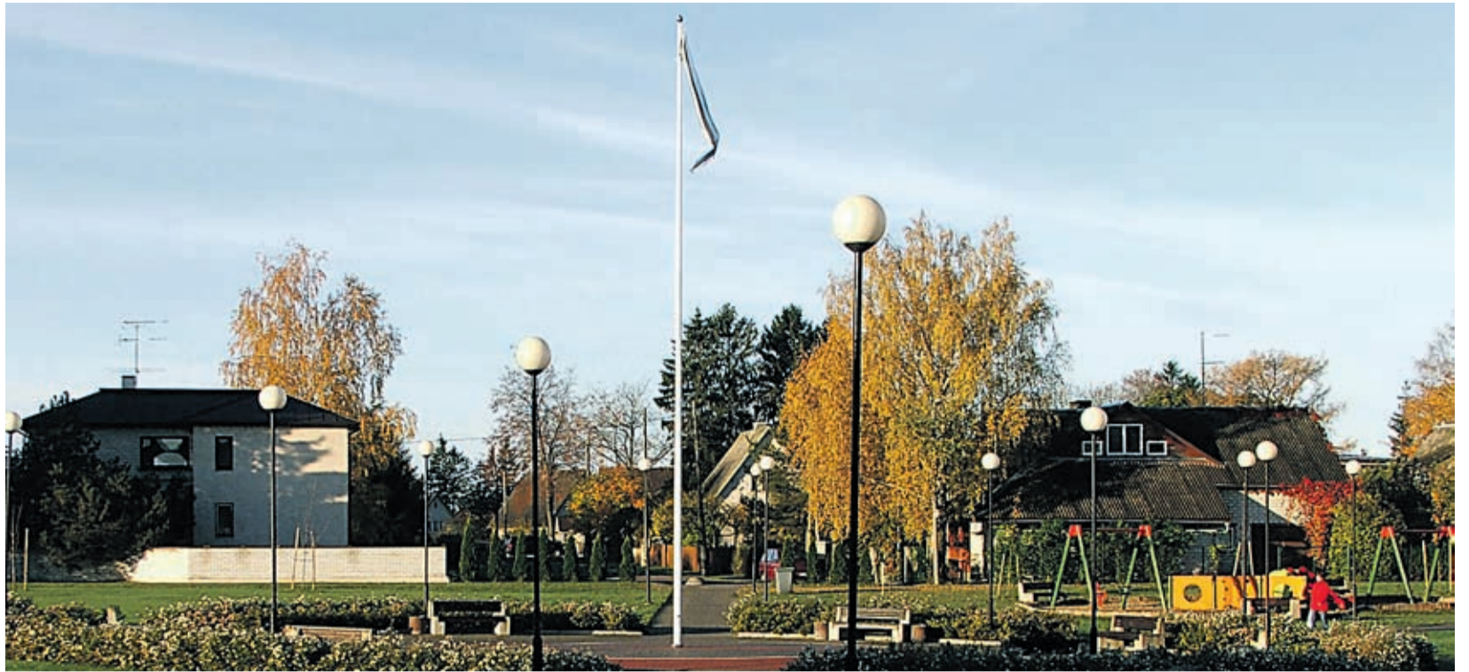
Saue linnavalitsus hoolib linlaste heaolust.

Pärast toetuse määramise kinnituse saamist on taotlejail investeeringu tegemiseks ja selle kohta kuldokumentide esitamiseks aega kaks aastat, seejuures võib kulutusi teha mitmes osas. PRIA maksab raha välja kolme kuu jooksul pärast kuludokumentide laekumist, kontrollides kohapeal üle, kas investeering vastab taotluse sisule.