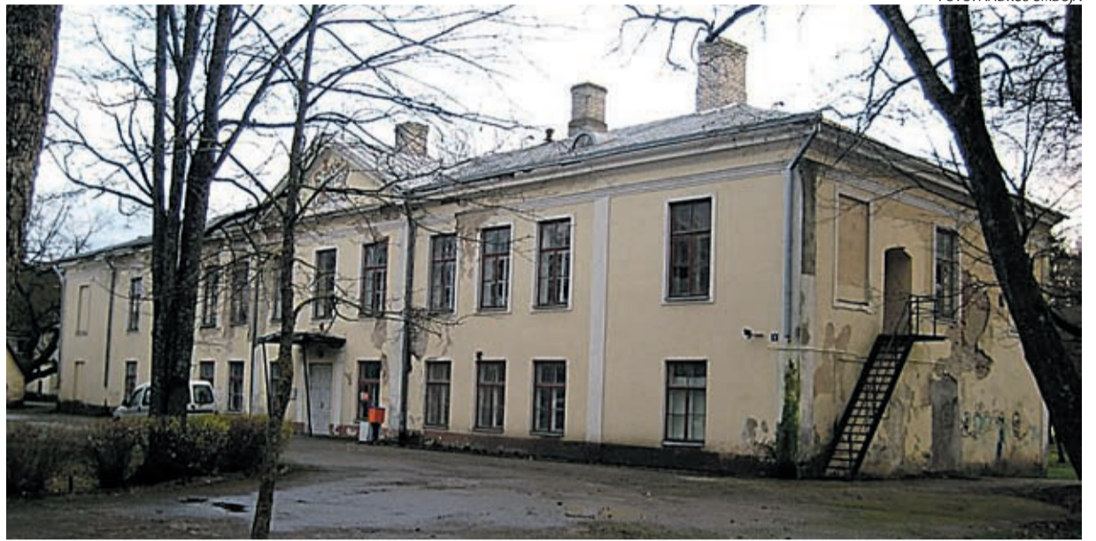
Ajalooline Kostivere mõisahoone vajab remonti.

Kostivere on ebatüüpiline väikeasula Tallinna linna kuldses ringis. Olles Jõelähtme valla suuruselt teine alevik, ei ole ta pälvinud sellist arengutoetust nagu linnalähedusest ning ajalooliselt kujunenud keskuse olemasolust eeldada võiks.