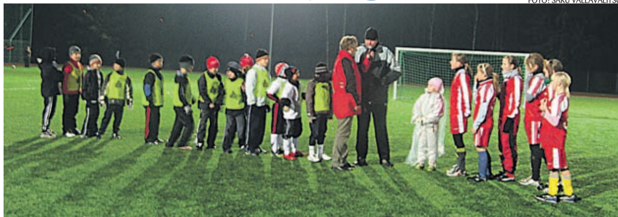
Saku jalgpalliväljaku õnnistasid sisse noored jalgpallurid.

Saku koolistaadioni aväiritust toetasid Saku vallavalitsus, Saku valla