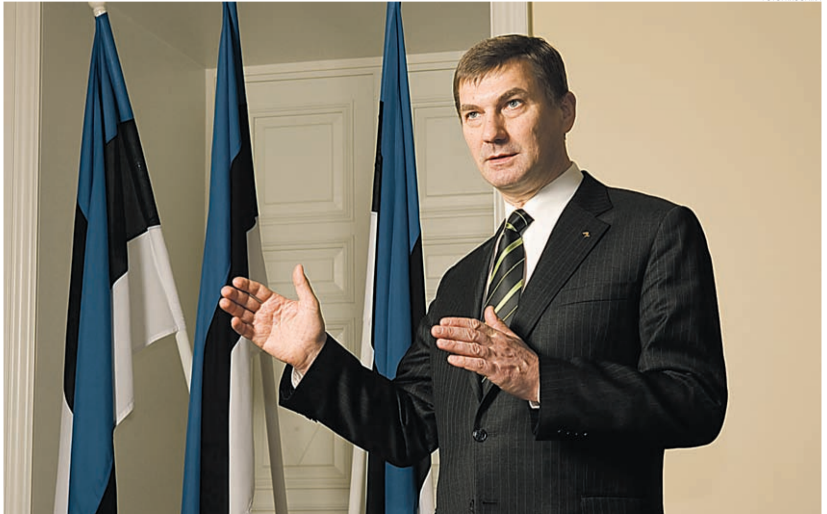
Peaminister Andrus Ansip hinnangul on Eesti kõige olulisem lähituleviku eesmärk ühinemine euroalaga.