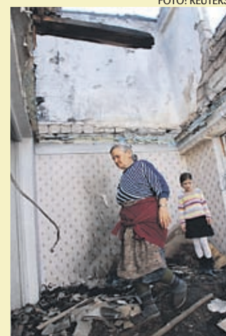
Grusiinide sõjast laastatud kodud tuleb taas üles ehitada.