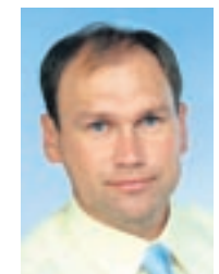
KALMER LAIN, abilinnaapea