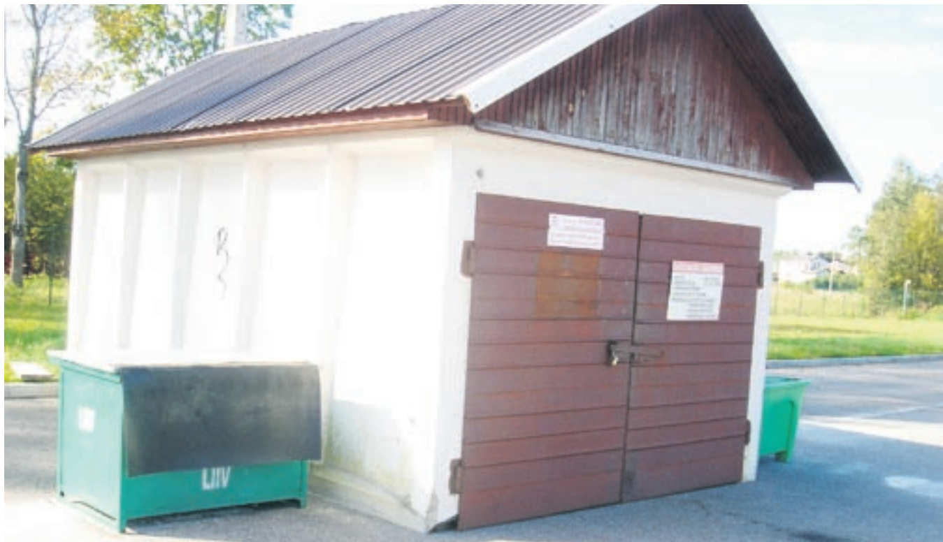
Ohtlikud jäätmed on jäätmejaamas aadressil Toominga tn 32, korralikult kogutud ja luku taga.