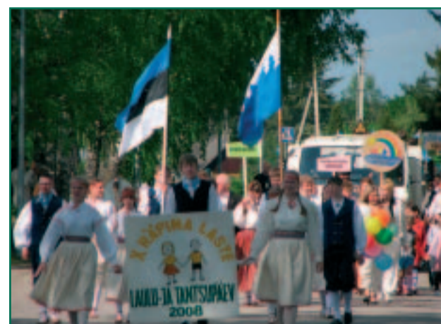
X Räpina Laste Laulu- ja Tantsupäev.