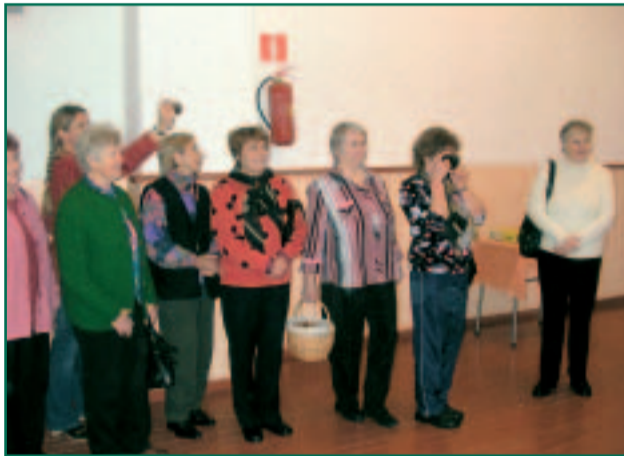
Röpina Maanaised annavad kohe üle oma külakosti.