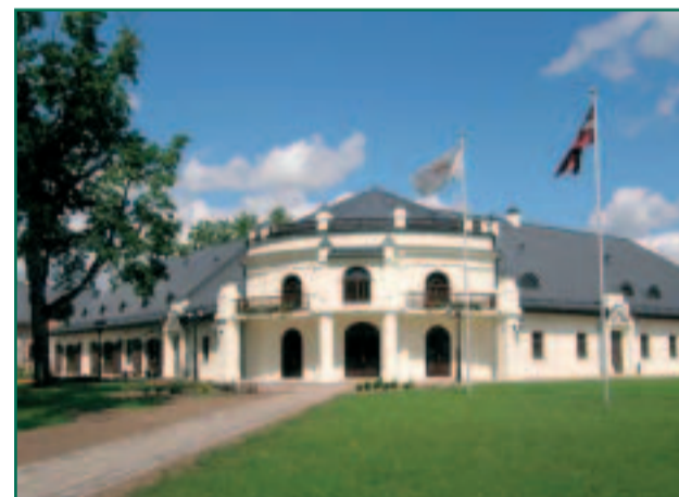
Vecgulbene mõisakompleks – mõisa ehitamine algas 1763. aastal kohal, kus kunagi asus orduloss. Oma täieliku hiilguse saavutas mõis 19. sajandil Wolfide suguvõsa omanduses. Mõisakompleksi restaureerimistööd alustati 2006. aastal. Praeguseks on varemetest taastatud mõisa hobusetall, juustukoda ning maneež. Viimasesse on rajatud uhke hotell ja spaa. Hetkel on taastamisel Valge loss – kõige imposantsema väljanägemisega neorenessansi stiilis hoone Baltikumis.