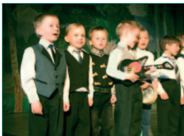
Lepatriinu rühma uljad laulumehed Räpina Lasteaia Vikerkaar kevadkontserdil.