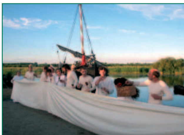
Tänavune suvelavastus "Pristan" oli põhjus, miks Võõpsus said kokku hansalodi Jõmmu, andekad ja tulihingelised harrastusnäitlejaid ning rohkearvuline heatahtlik publik.