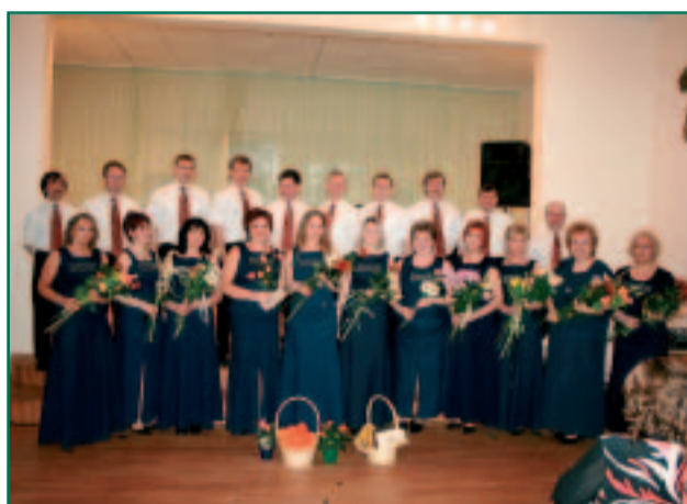
Räpina Kammerkoor tähistas 20. sünnipäeva täispika kontserdiga puupüsti täis muusikakooli saalis.