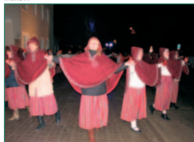
Advendiküünla süütamine Räpina vallamaja ees. Teiste seas oli meeolelu loomas rahvatantsurühm Murelid.