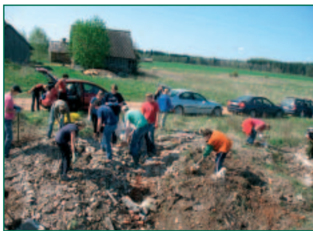
Teeme ära 2008 talgulised Raiglas.