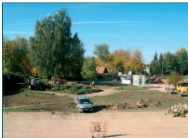
Räpina keskväljaku ühe ajastu lõpp.