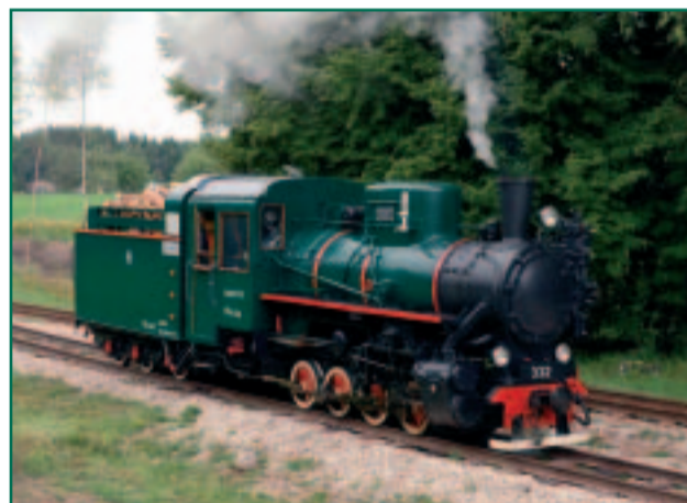
Kitsarööpmeline raudtee – ainus kasutuses olev kitsarööpmeline raudtee Baltikumis, rajatud aastal 1903.