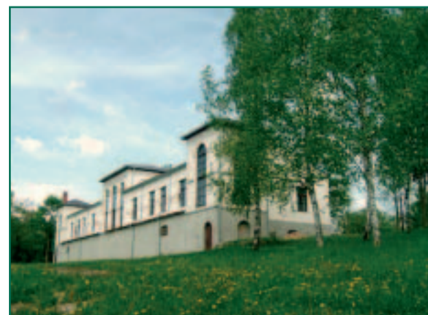
Gulbene Ajaloo- ja Kunstimuuseum – rajatud 1982. Muuseum pakub vaatamiseks püsiekspositsiooni Gulbene ajaloo ning samuti temaatilisi näitusi.