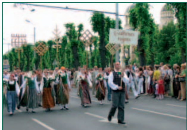
Gulbene rajooni esindus tänavusuvises Riia laulupeo rongkäigus

NB! Gulbene on alati külalistetootel, eriti aga kõiksugu tähtpäevadel: peetripäeval (juuni viimane laupäev) muuseumis, linna aastapäeval (juuli viimane nädal), kitsarööpmelise raudtee tähtpäeval (septembri esimene laupäev), eriti meeldib gulbenelastele külalistega jaanipäeva veeta.