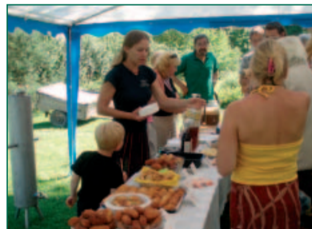
Küladepäeval piruka-, õlle- ja veinimeistri valimisel kujunes võistluslaud oodatust palju-palju pikemaks ja healõhnaliskemaks...