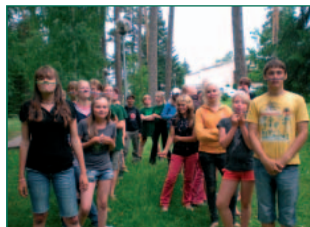
Põlvamaa Õpilasmalev 2008 – üksmeelsed töökad Räpina malevlased.