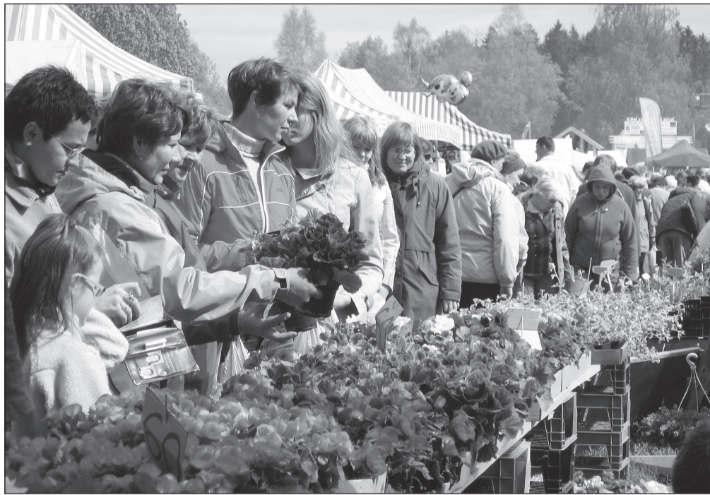
Lillelaadal on nõutavaimaks kaubaartikliks ikka lilled ja istikud.

Kui laupäeval laadapäeval oli liikumisruumi väga napilt, jäi külastajate rekord tänavu loomata. „Kui meil oleks arvestus ka külastajate arvu kohta tunnis, siis oleks laupäeval tõenäoliselt rekord