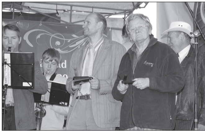
Lillelaada avauritusel liitusid orkestriga Türi ka põllumajandusminister Helir-Valdor Seeder ja Riigikogu esimees Ene Ergma.