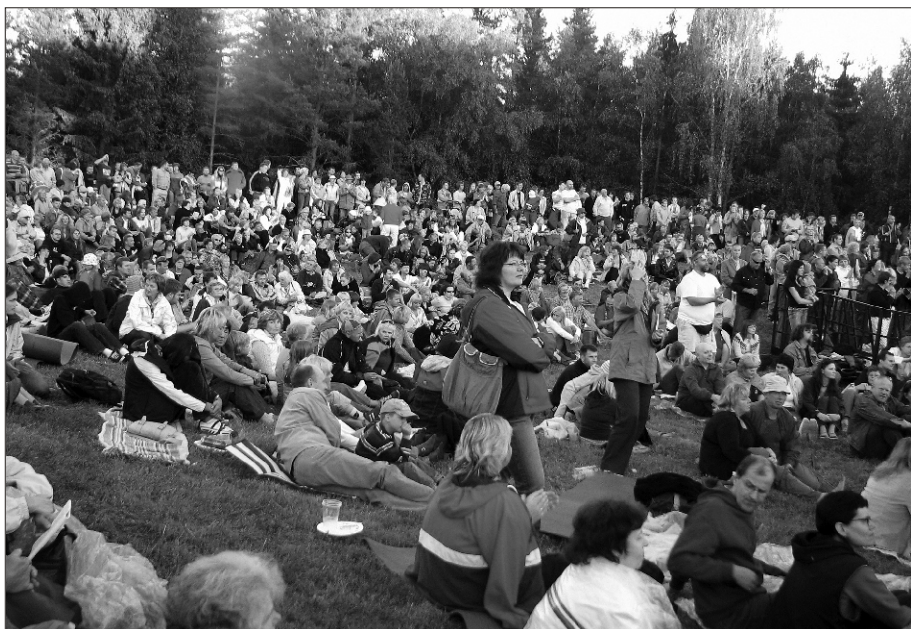
Eelmisel aastal oli linnamäe kontserdil paar tuhat kuulajat