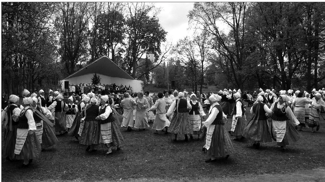
Tantsijad täitsid kogu lauluväljaku muru.