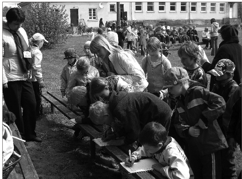
Kondase pargis jätkus kõigile tegevust