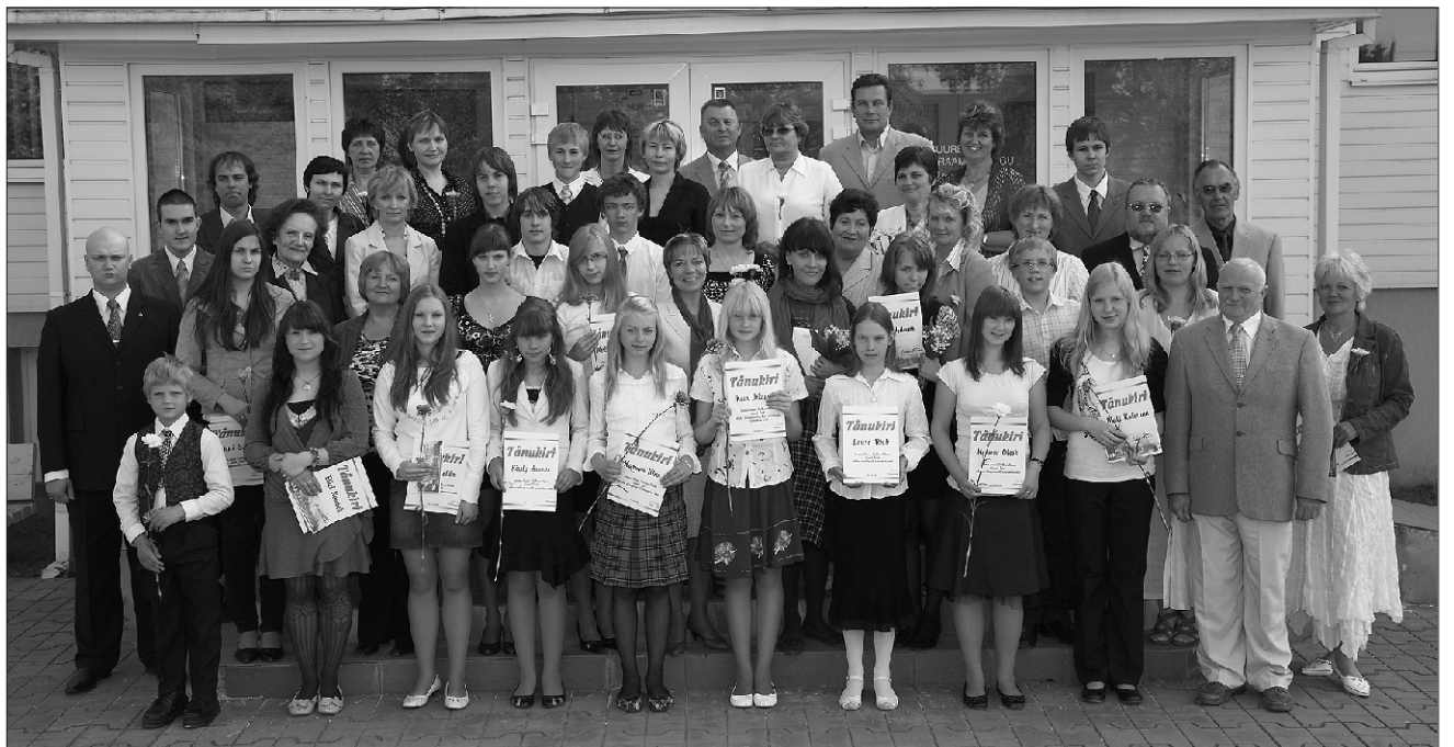
Suure-Jaani vallavanem võttis 26. mail vastu valla koolide tublisid õpilasi - kes saavutanud häid kohti olümpiaadidel ja konkurssidel - nende vanemaid ja õpetajaid.