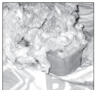
...ja päält hiire käkmistüüd. SAARÕ EVARI PILDI