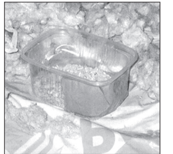
Hiirekihvti karp inne...