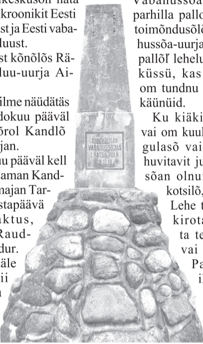
Vabahussõa avvusammas Haanin.

Paiga pääle oodõtas nii Põlvan ku Võrol kõiki aoluu-huviliidisi.