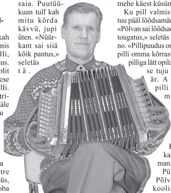
HARJU ÜLLE PILT

Mustri tull Tartese sõnno perrā «loomuligust intelligentist». Pill helkäs külh kõvastõ ja Tartes kitt, et parhillatsõl aol om jo kõiksugumast matõrjaali saia. Puutüükuan tull kah mitu kõrda kävvü, jupi ütē. «Nüürkant sai siia kõik pantus,» seletäs t ä .