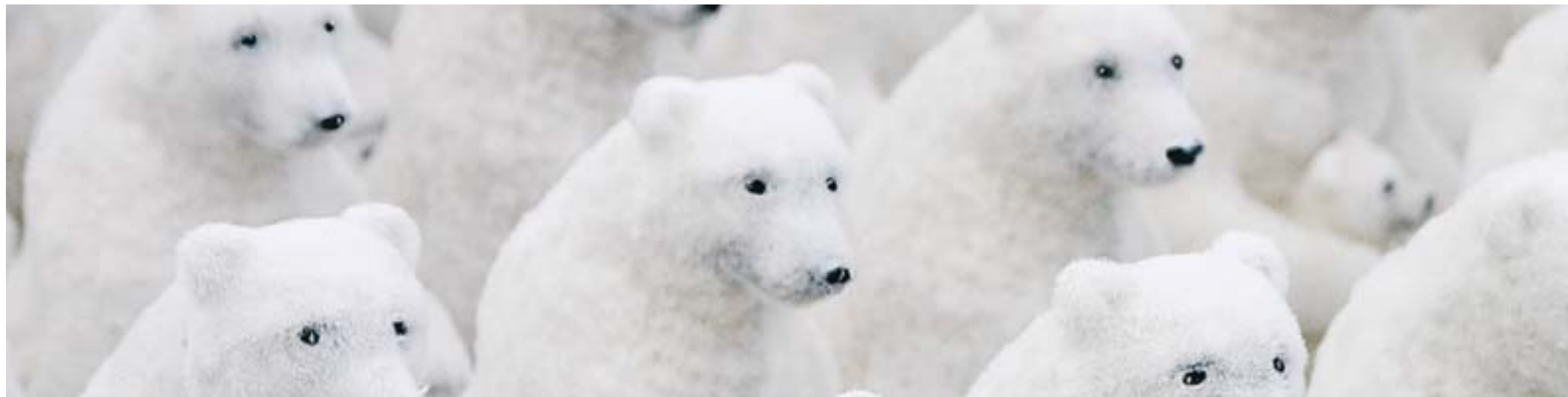
Зеленые не безлики и не безымянны. Знакомьтесь: это люди яркие, идеи их осмысленны.

К счастью, бронзовый якорь поднимать не надо, этот якорь в головах людей. Давайте сменим тему разговоров, обсудим новые идеи и проблемы. Поучимся! Наполнимся новой энергией.