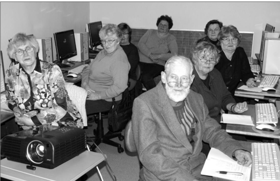
Oktoobris algasid arenduskojas eaktele ja puuetega inimestele mõeldud 24-tunnised arvuti algteadmiste omandamise tasuta kursused.