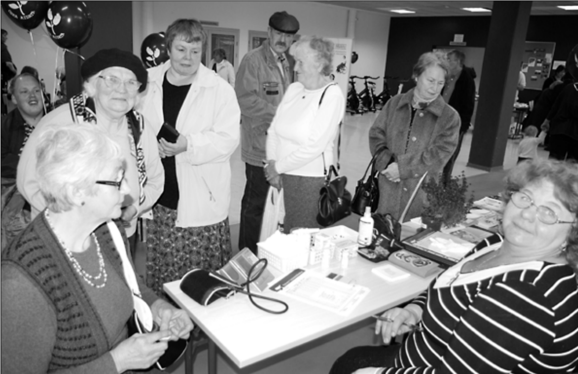
4. oktoobril toimus spordihoones infopäev "Oska aidata", kus soovijatel oli võimalus mõõta ka vererõhku ning veresuhkru- ja kolesteroolitaset.