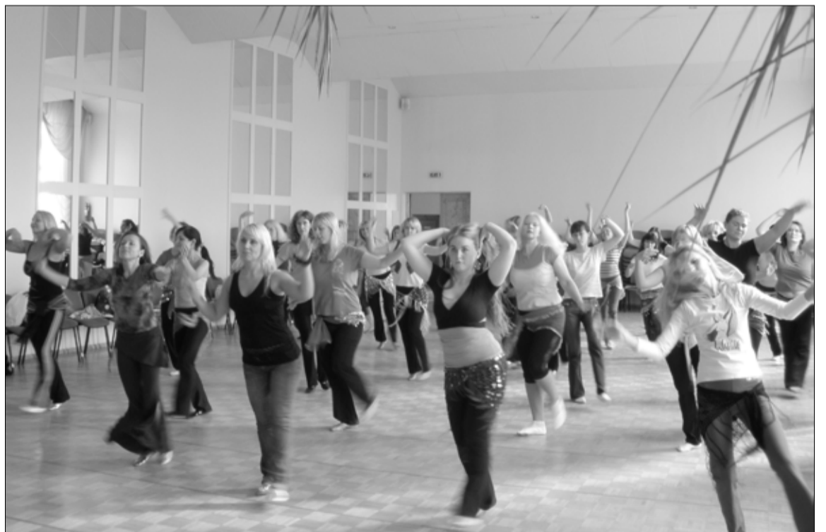
Tapa piirkonna kõhutantsuhuvilised kogunesid septembri alguses gümnaasiumi aulasse uusi teadmisi saama.