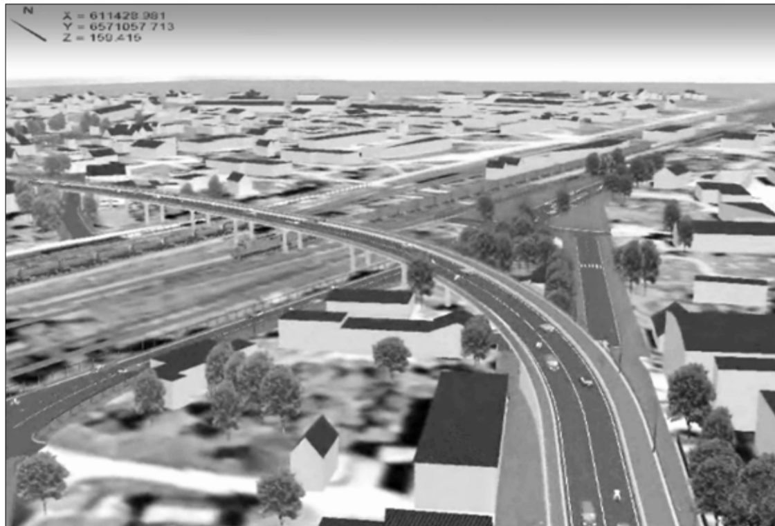
Arvutianimatsioonis on näha, et lõunapoolne viaduktile pealesõit hakkab toimub Ambla maantee gümnaasiumitaguselt osalt.

Näitus on üles pandud meie oma koduvalla inimeste saadetud fotodest! Tule, imetle kauneid pilte ja vali oma lemmik! Enim meeldinud fotole auhind!