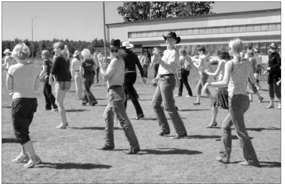
Line-tantsuga saab tegeleda nii väljas vabas looduses kui ka nelja seina vahel.