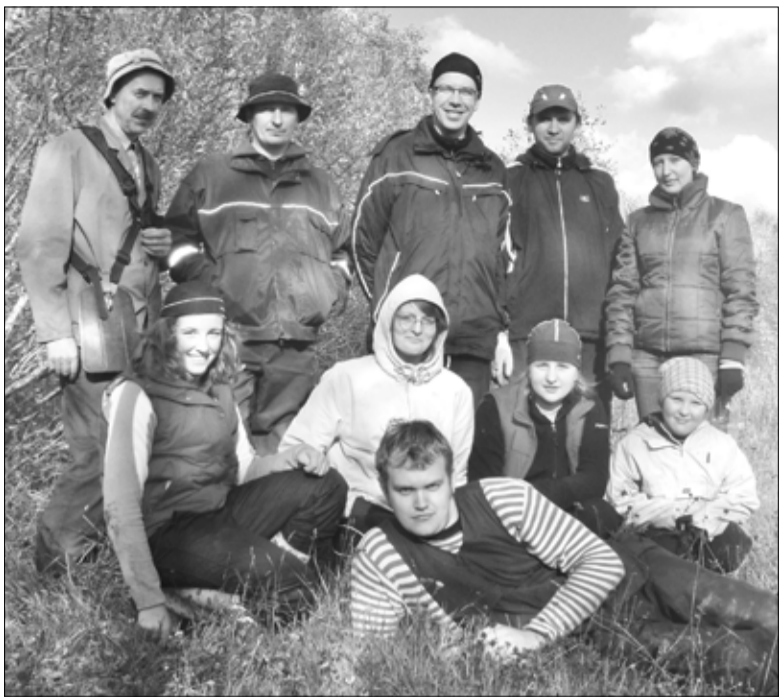
Rutka matkadade korrastajad pärast talgupäeva.