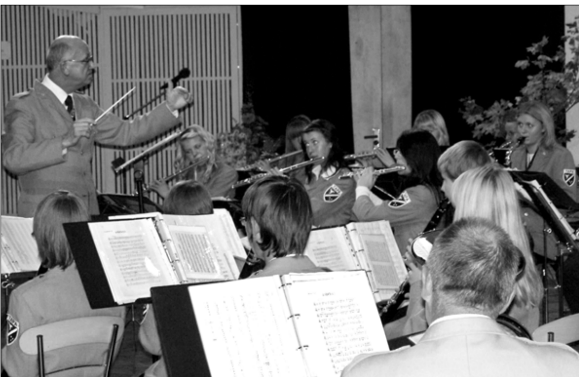
4. oktoobril esitles Tapa Linna Orkester kultuurikojas oma esikplaati "Värvid".