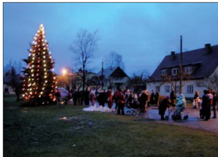
Paikuse Vallavolikogu ja -valitsus

Ligi sajale 80 aastasele ja vanemale vallakodanikule viivad sotsiaaltöötajad koju kätte jõulutervitustega kaardikese 100 krooniga.