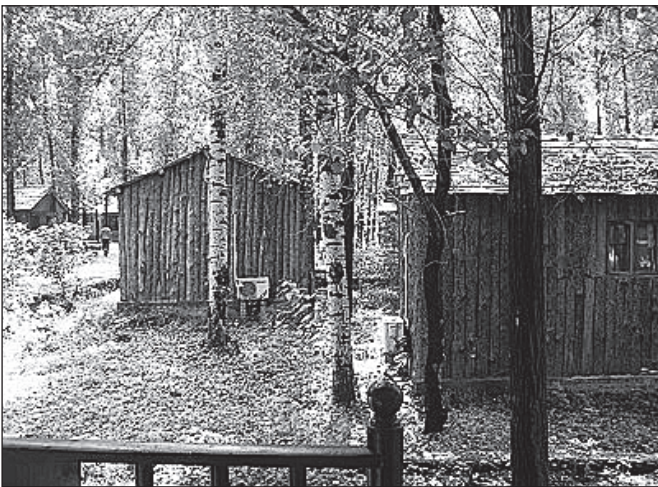
Paljukiidetud Kahe Pardi Rantšo majutas eestlasi ka sellistes onnides.

Miks ma oma kasvandikuga olümpiale minekust alles nüüd, küpse treenerina, mõtlesin hakasin? Aga sellepärast, et minu tahtest kasvandiku