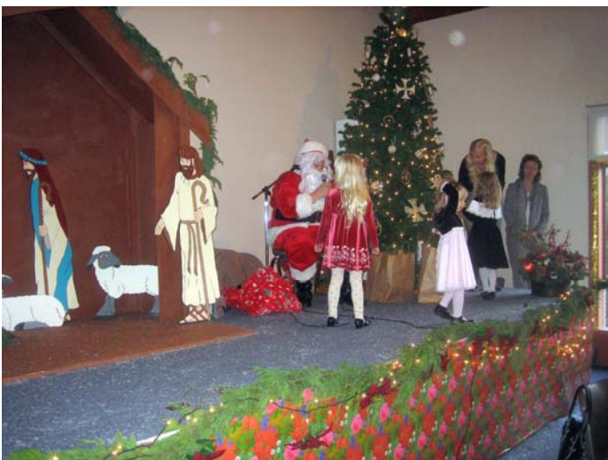
Santa Claus' visit at the Christmas party on 16 December 2007 in San Mateo.

It seems that the older we get, time goes by ever faster. No sooner the candles and decorations have been taken down and the Christmas tree placed on the street corner, Independence Day demands our attention. Especially since this year it is Estonia's 90th. And is it really already almost 17 years since re-independence? In Estonia, the celebrations last all year. Let us also be there, either in church or at the Saturday party organized by the Estonian Society.