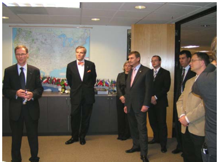
At the reception for Prime Minister Andrus Ansip at the Enterprise Estonia offices in San Jose, 30 November 2007.