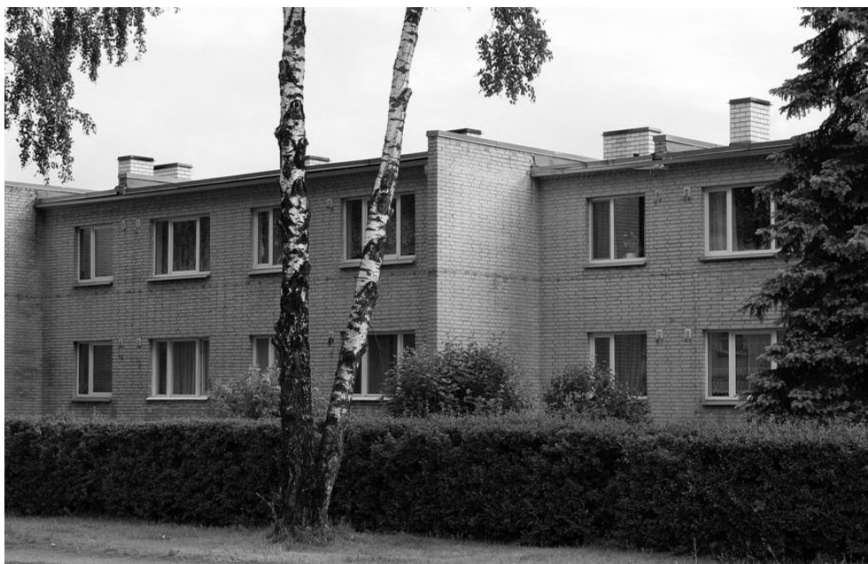
Vastu võetud seadusemuudatused ja veel menetluses olevad eelnõud hakkavad korteriühistutele lisakulutusi tootma.

"Oleme seisukohal, et ministeerium on rikkunud head haldustava ning ei ole kaasanud liitu sedavõrd oluliste muudatuste tege-